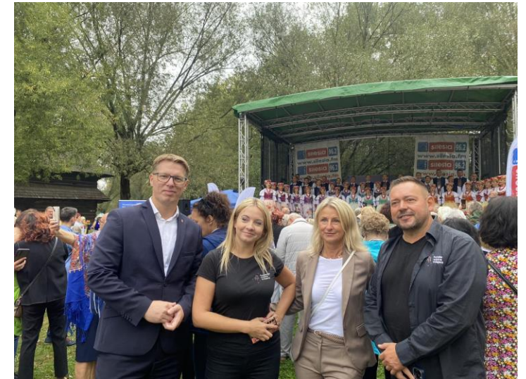
IV Targi SILVER SILESIA