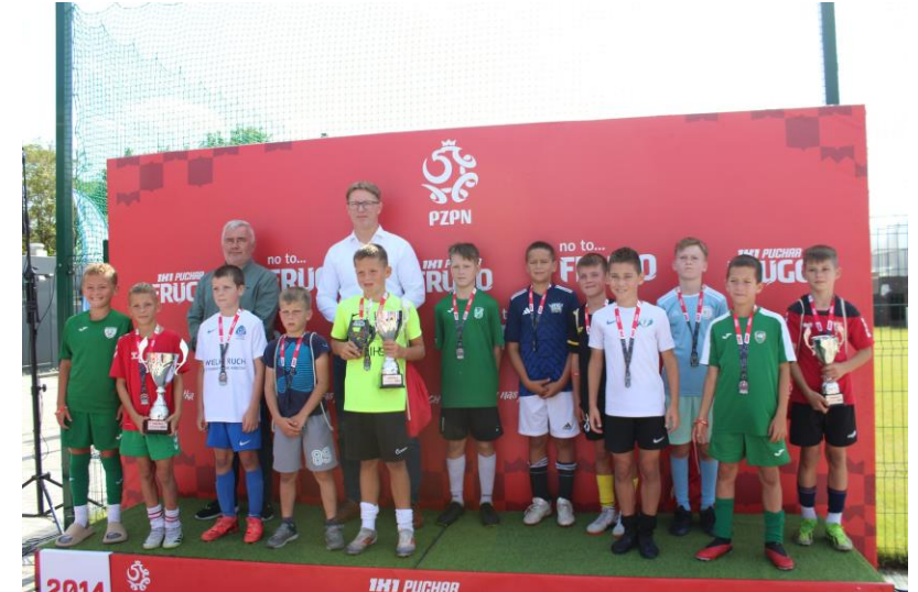
Finał wojewódzkiego turnieju gry 1x1 - pucharu Frugo w Świętochłowicach