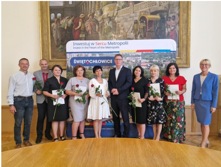
Wręczenie aktów mianowania dyrektorom świętochłowskich szkół