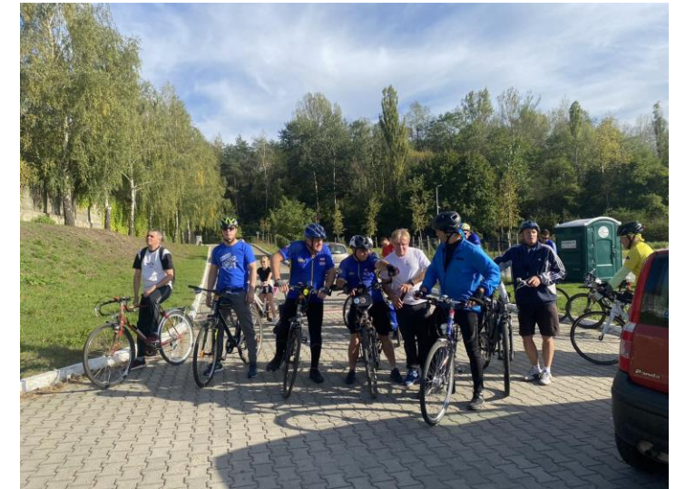
Europejski Tydzień Mobilności – przejazd rowerowy Kalina-Skałka