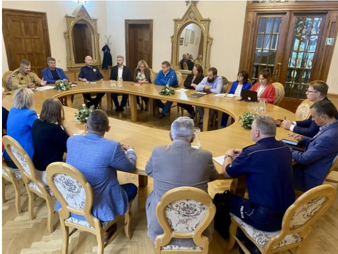
Spotkanie ze służbami mundurowymi i naczelnikami – dot. zagrożenia wynikającego z warunków pogodowych