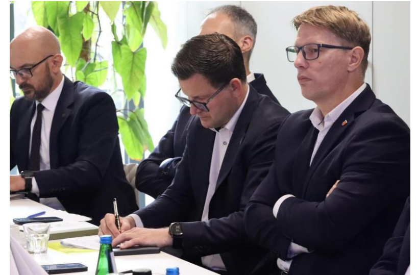
Spotkanie z prezydentami miast powiatowych województwa śląskiego w celu omówienia najważniejszych wyzwań stojących przed samorządami