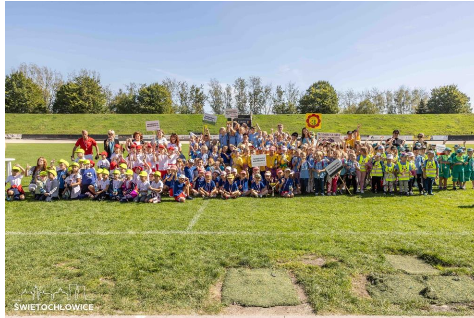
VI Olimpiada Przedszkolaka