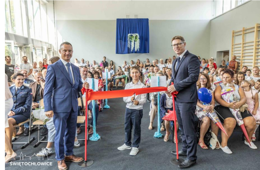
Miejskie obchody rozpoczęcia roku szkolnego w Szkole Podstawowej nr 19 im. Bolesława Chrobrego w Świętochłowicach