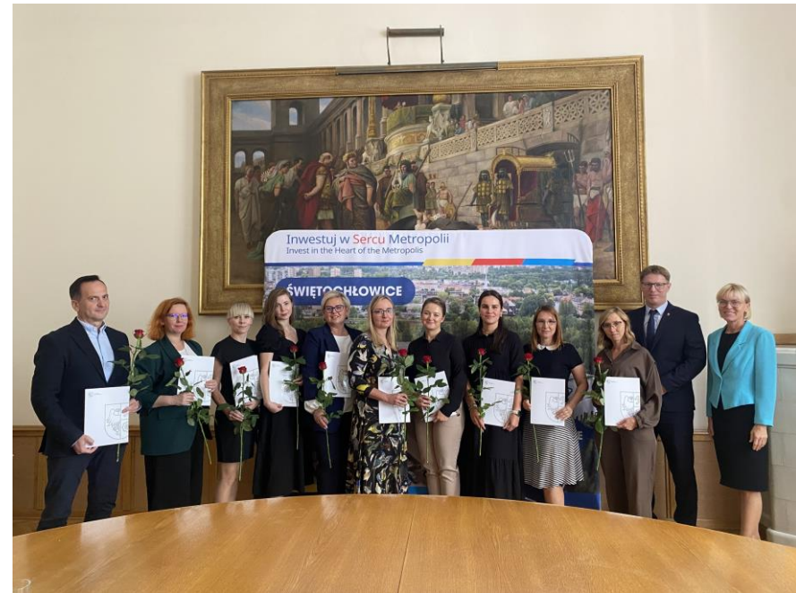
Wręczenie aktów mianowania nauczycielom świętochłowskich szkół