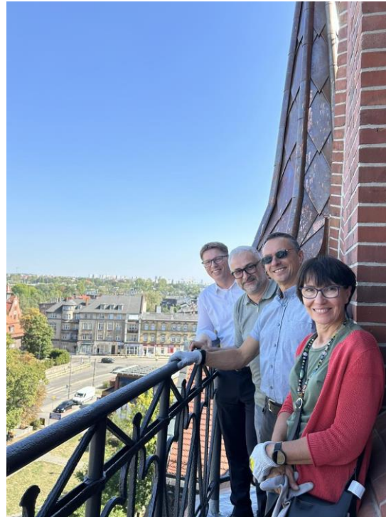
Wizyta gospodarska na wyremontowanej wieży Kościoła Ewangelickiego w Świętochłowicach