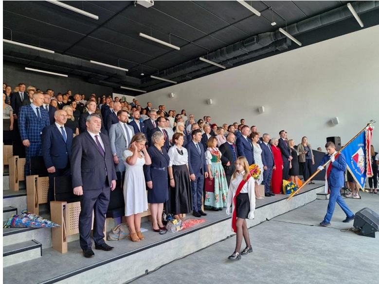
Wojewódzkie obchody rozpoczęcia roku szkolnego w nowym gmachu Szkoły Podstawowej nr 17 w Rudzie Śląskiej