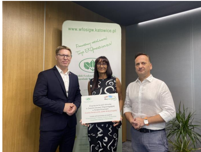
Udział w przekazaniu promes na projekty środowiskowe „Ekopracownia pod chmurką 2024”