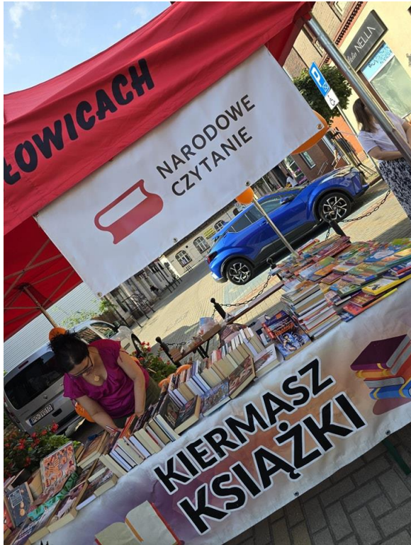
Akcja „Narodowe czytanie” przy ul. Katowickiej