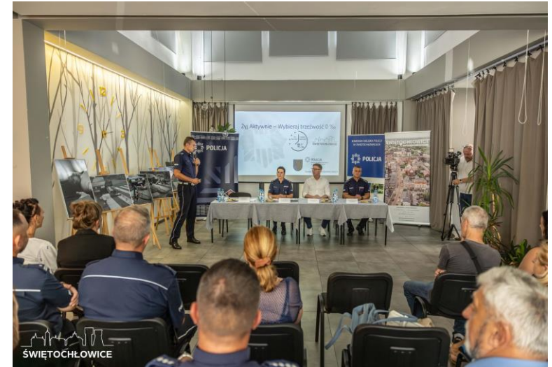
Udział w prezentacji spotu informacyjno-edukacyjnego pn. „Żyj aktywnie-Wybieraj trzeźwość 0‰”