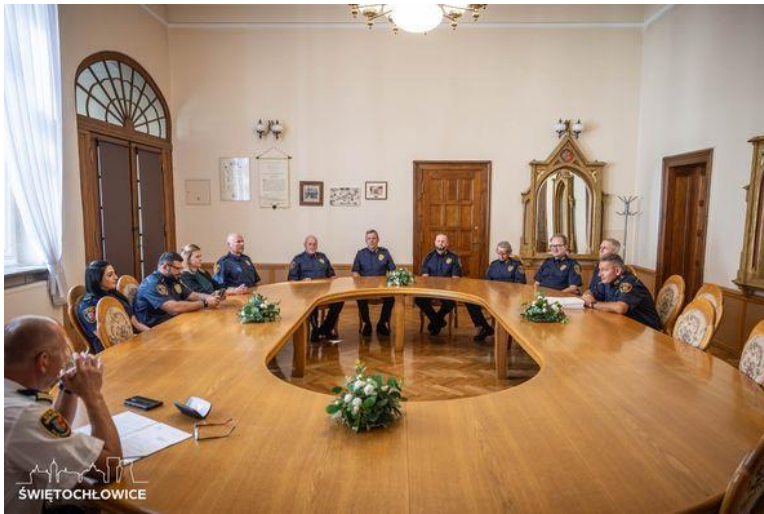
Święto Straży Miejskiej