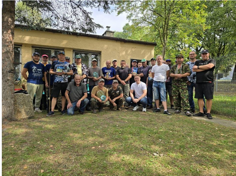
Zawody wędkarskie na stawie Foryśka