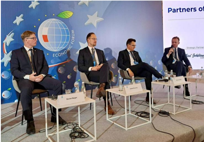
Uczestnictwo w panelu dot. finansowania samorządów podczas Forum Ekonomicznego