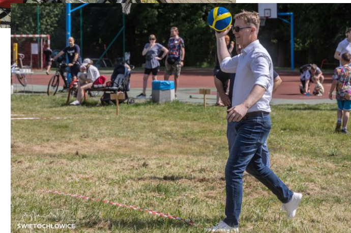
Rowerowe In Motion