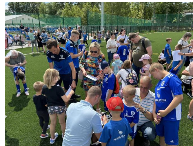
Dzień Dziecka z MKS Śląsk DEMARKO Świętochłowice oraz Ślązaczkiem