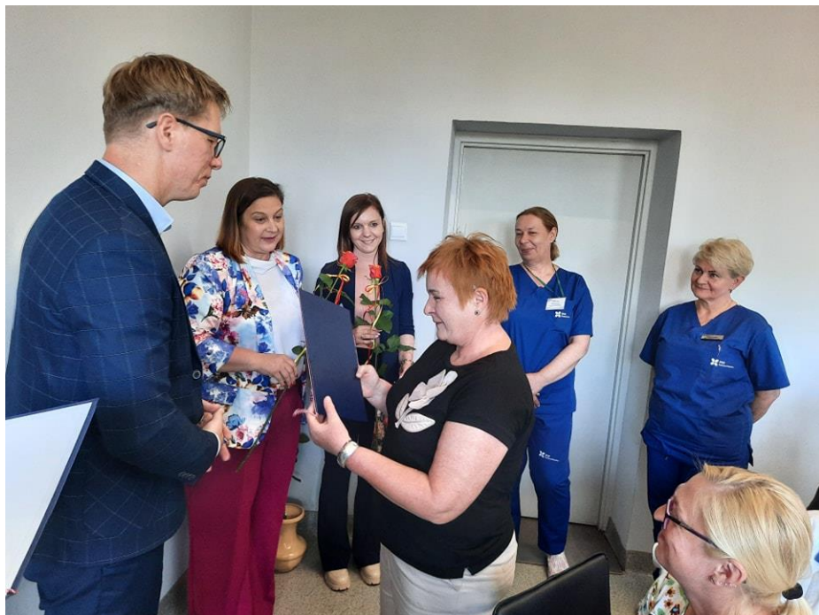
Święto pielęgniarek/pielęgniarzy i położnych