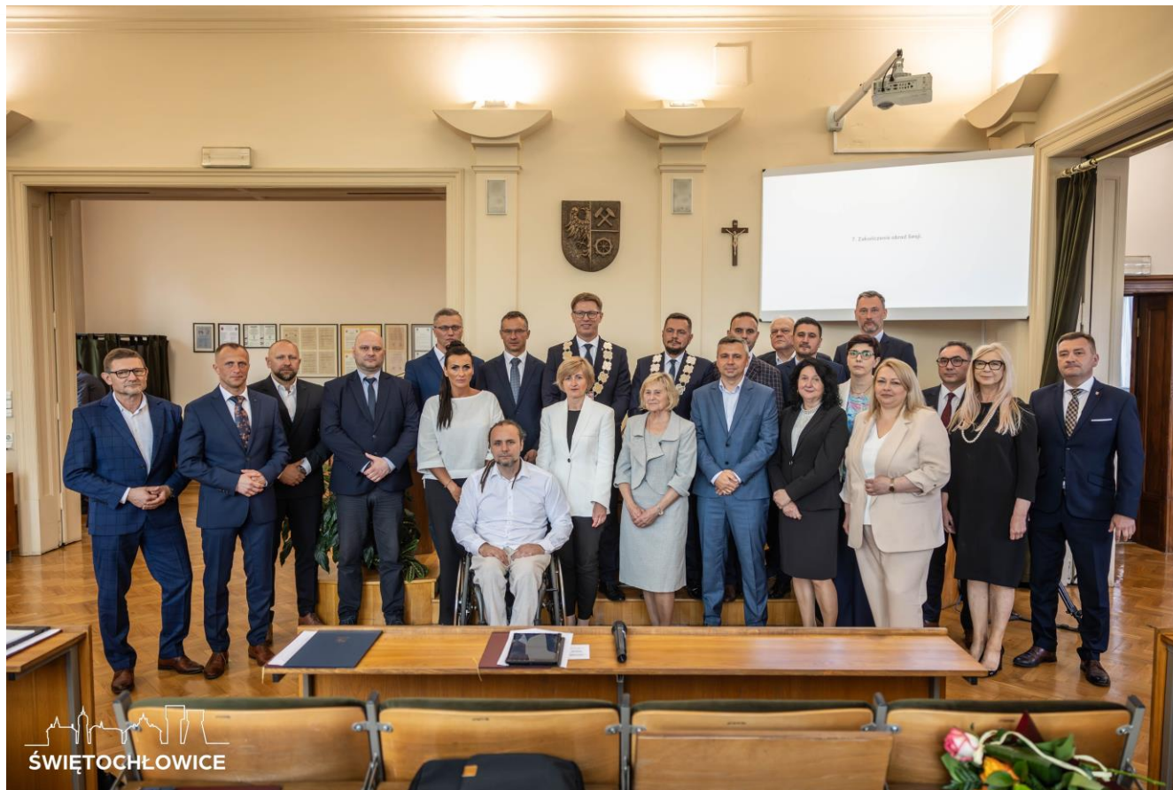
Inauguracyjna Sesja Rady Miejskiej