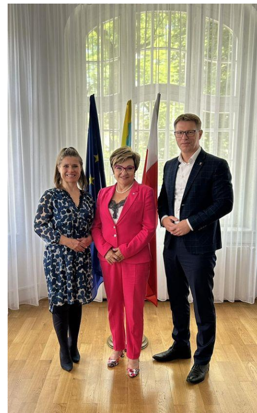
Spotkanie z Mirosławą Nykiel Posłanką na Sejm RP i Ewą Kołodziej Posłanką na Sejm RP