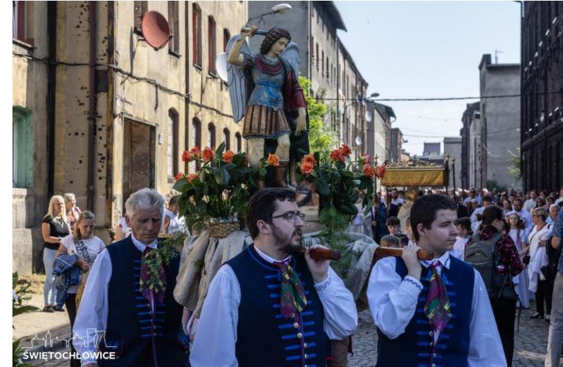
Procesja Bożego Ciała