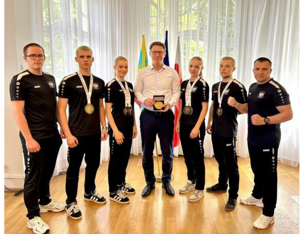
Wizyta multimedalistów Taekwon-Do Świętochłowice