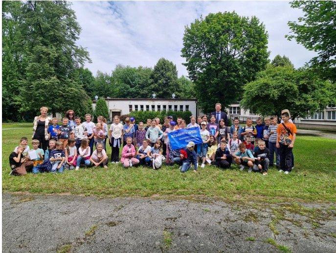
Uniwersytet Dziecięcy Akademii WSB