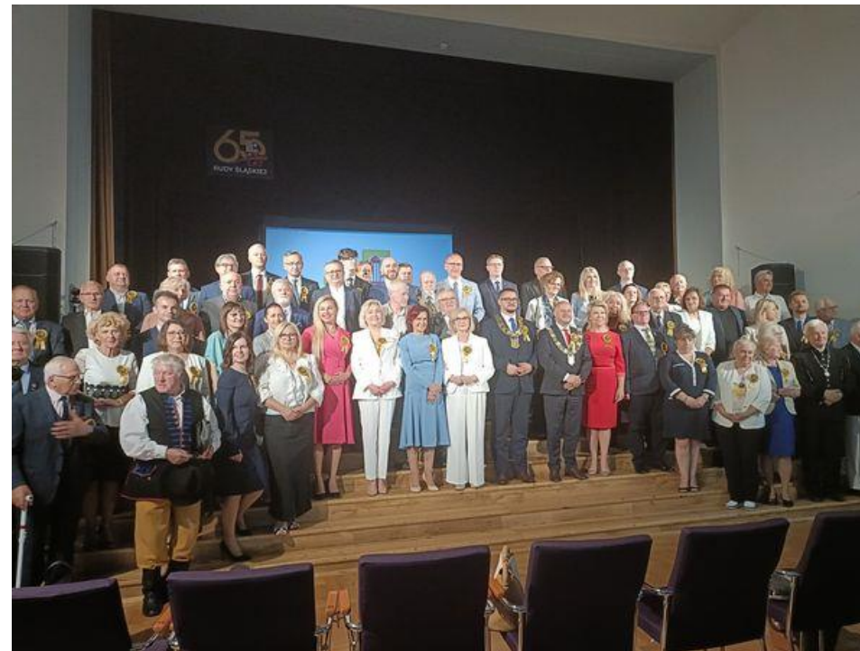
Udział w Jubileuszu 65-lecia połączenia kilkunastu dzielnic w jedno miasto Ruda Śląska