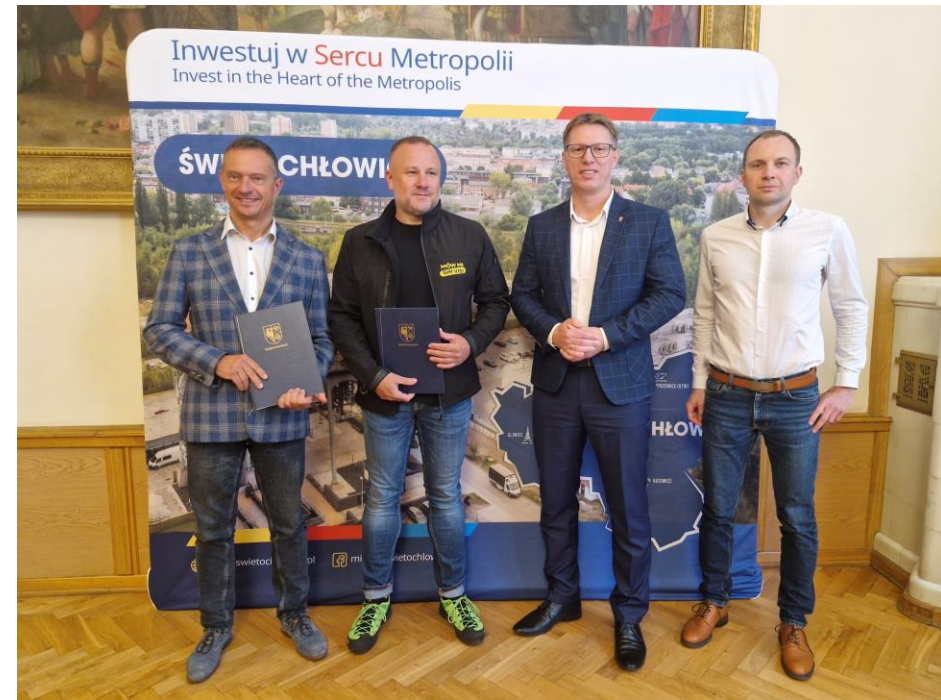
Podpisanie umowy z firmą NextBike GZM Sp. z o.o.