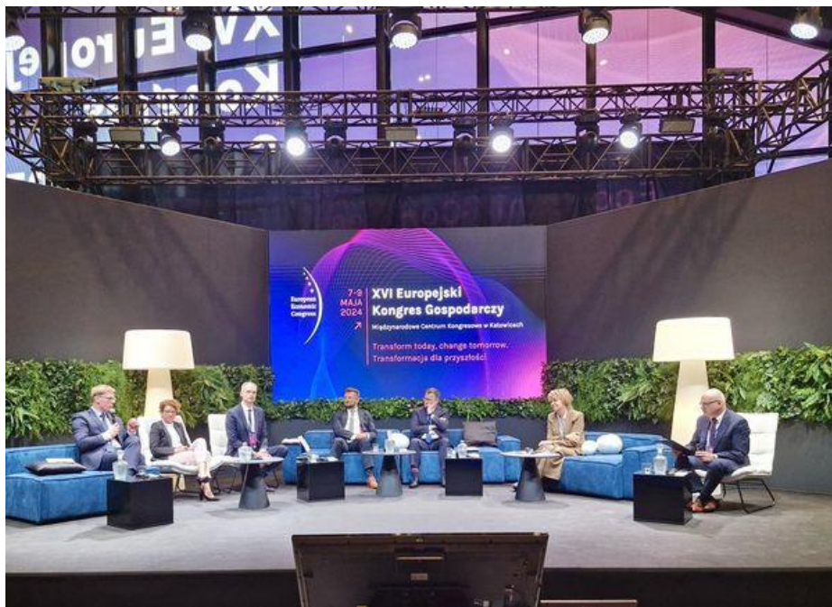
Udział w XVI Europejskim Kongresie Gospodarczym