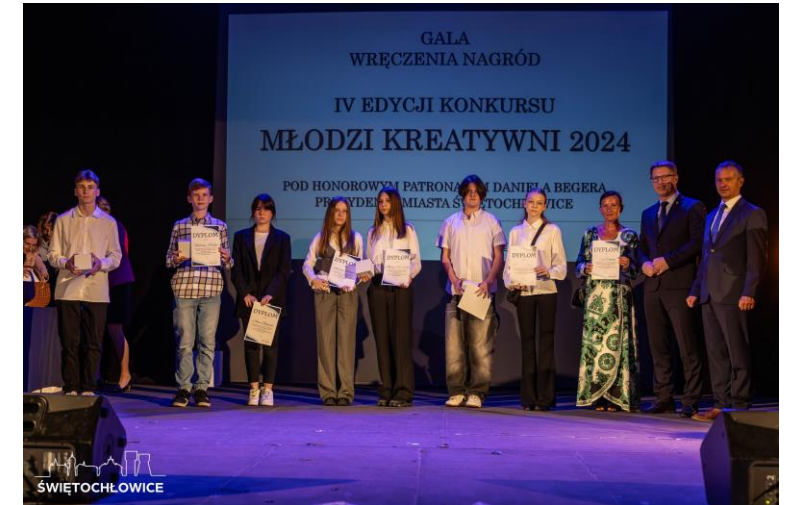
Gala Młodzi Kreatywni w CKŚ