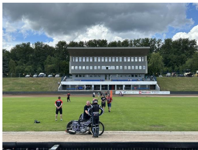
Udział w treningu Abramczyk Polonia Bydgoszcz