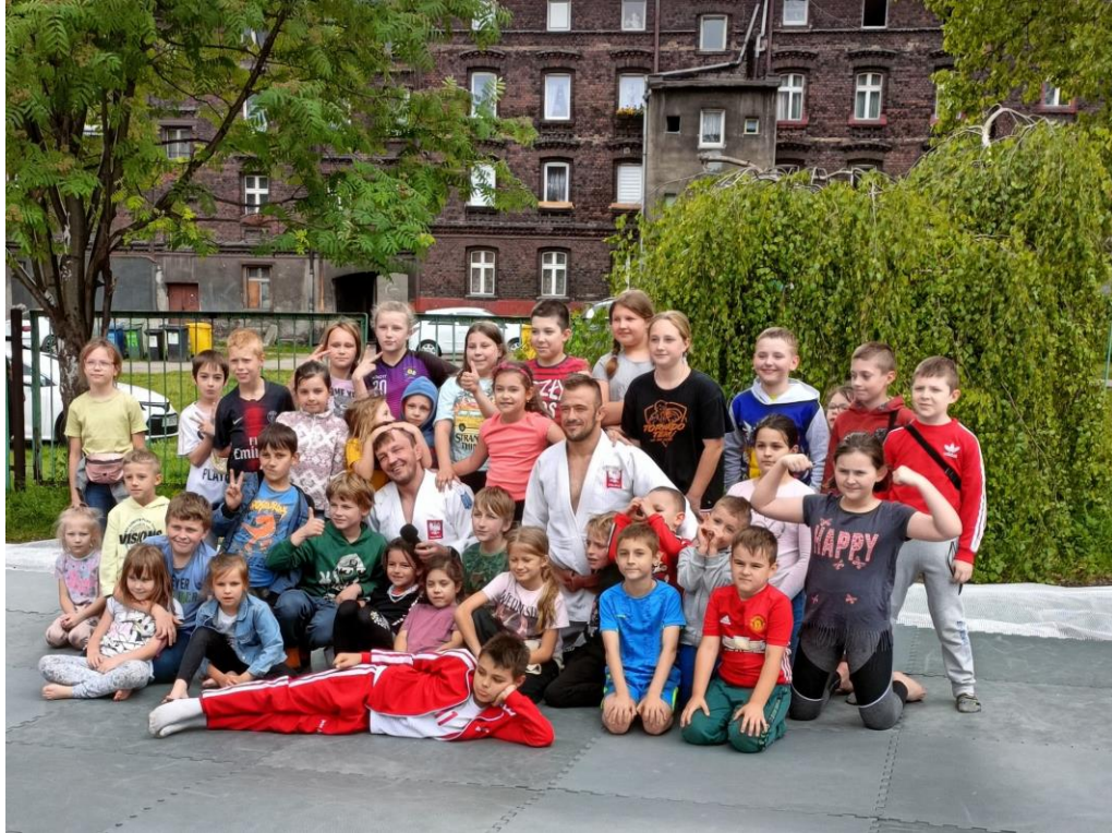
Udział w Festiwalu sportowym zorganizowanym przez Tornado Team Świętochłowice