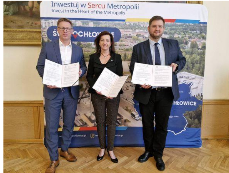
Podpisanie listu intencyjnego i porozumienia o współpracy pomiędzy Zespołem Szkół Technicznych i Zawodowych w Świętochłowicach Z Akademią Górnośląską w Katowicach