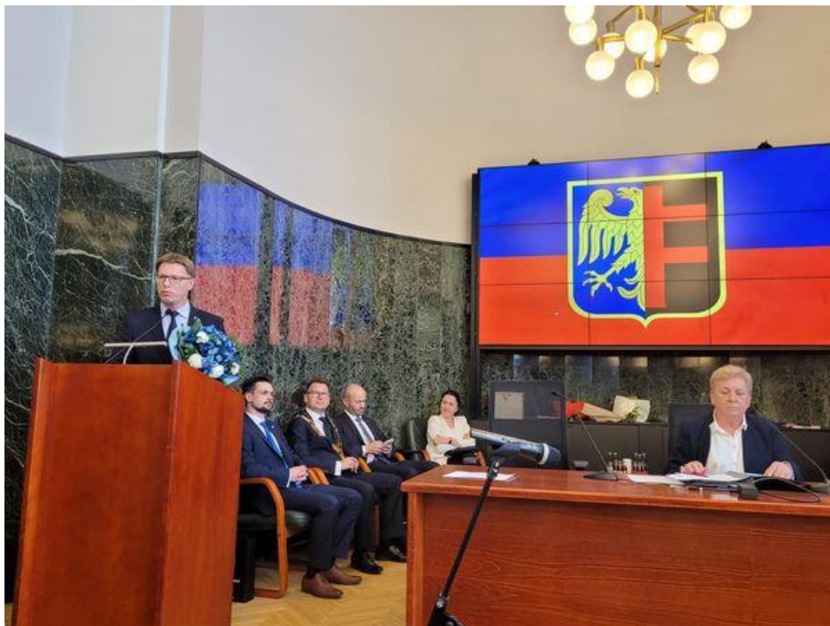
Udział w zaprzysiężeniu Prezydenta Miasta Chorzów