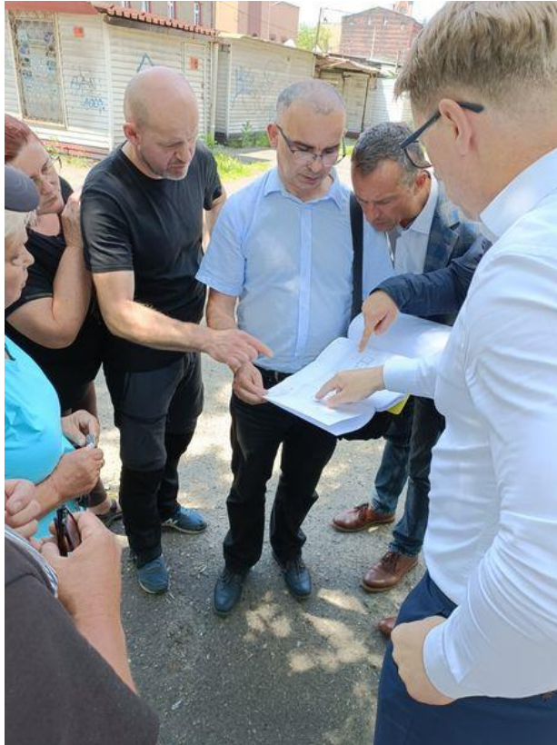
Wizja lokalna w sprawie realizacji projektu „Modernizacja Placu Targowego przy ul. Kubiny” w ramach Budżetu Obywatelskiego