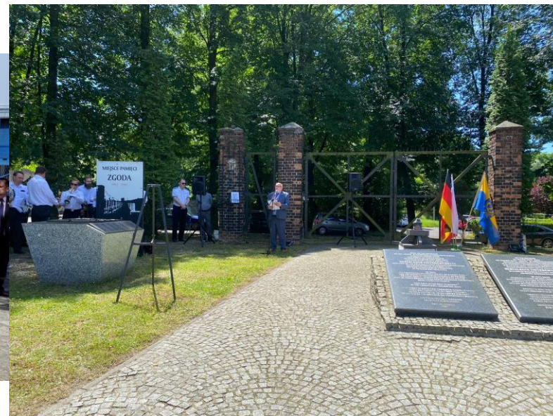
Dzień Pamięci Ofiar Obozu Zgoda