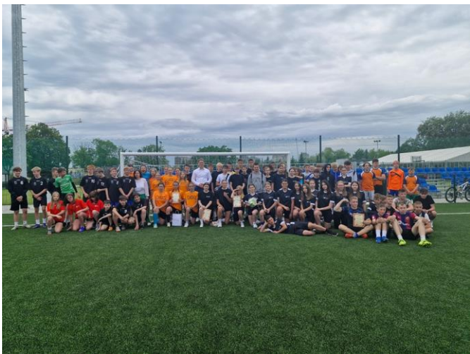
Udział w Miejskich Zawodach Piłkarskich na OSiR Skątka