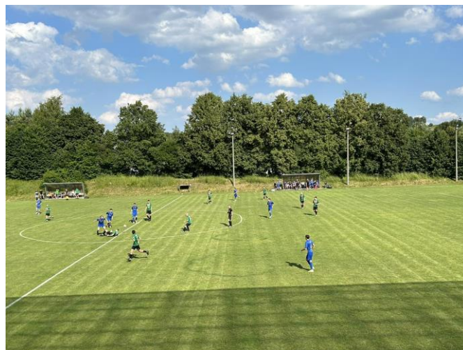
Udział w meczu MKS Śląsk DEMARKO Świętochłowice z MKS Górnik Wojkowice