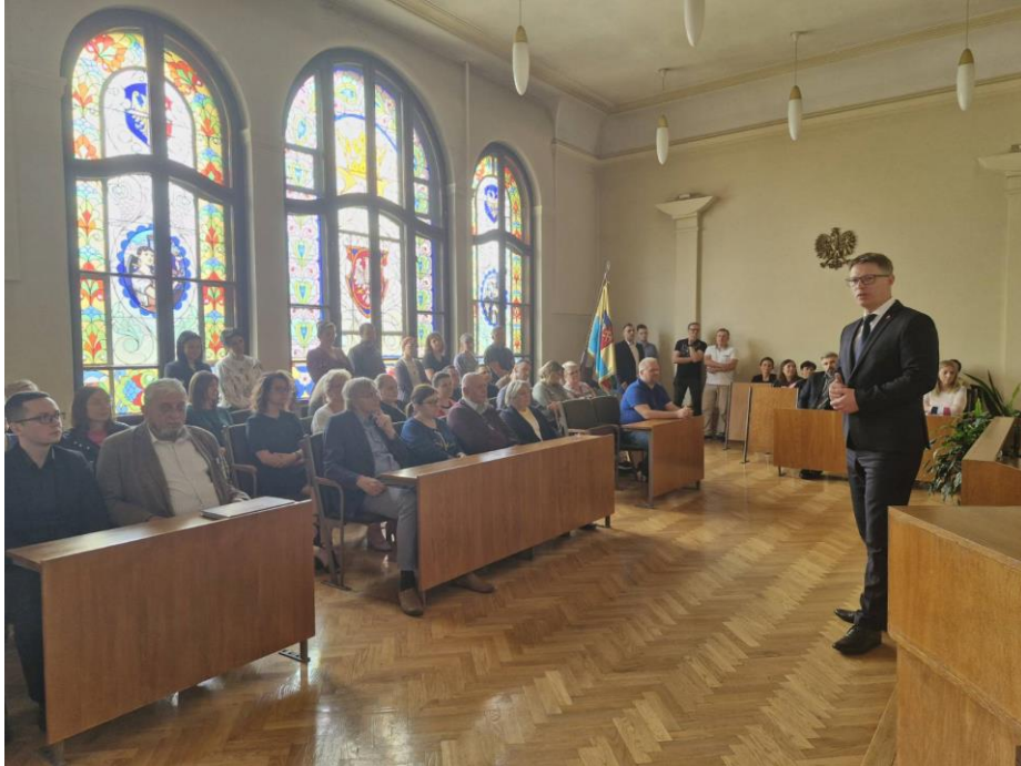
Dzień Samorządu i Pracownika Samorządowego