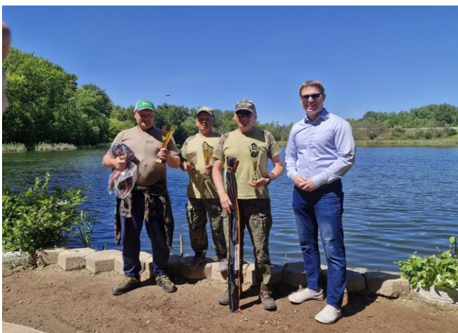
Liga szałwikowa na stawie Magiera