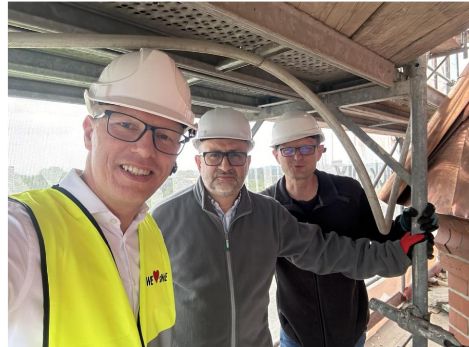
Wizyta gospodarska na remontowanej 50-metrowej wieży Kościoła Ewangelickiego w Świętochłowicach