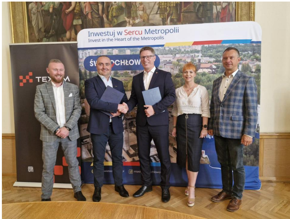
Podpisanie umowy na remont CKŚ Grota