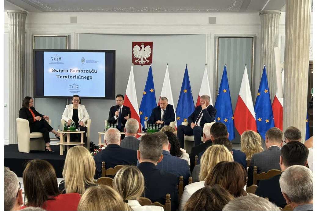
Udział w konferencji dotyczącej Święta Samorządu Terytorialnego