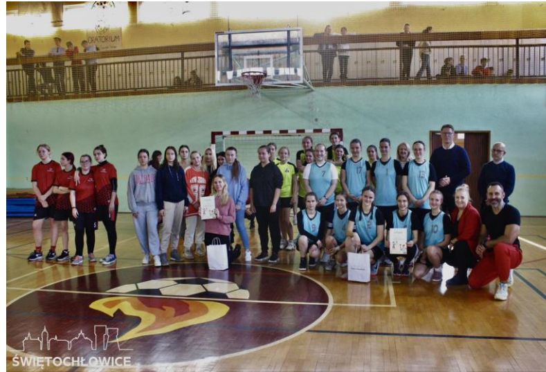
Miejski Turniej Szkół Ponadpodstawowych dziewcząt