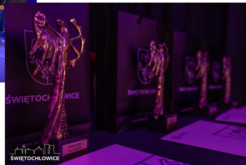
Gala Zasłużony dla Miasta Świętochłowice