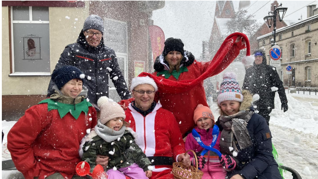
Kiermasz Stowarzyszenia Wszyscy Razem Wszyscy Równi