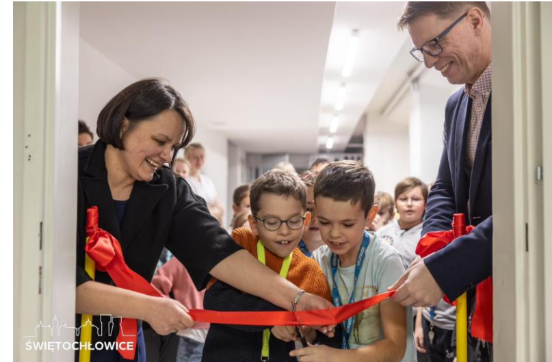
Otwarcie nowej jadalni w SP4