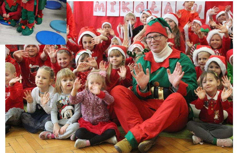
Miejskie Mikołajki w Przedszkolach Miejskich