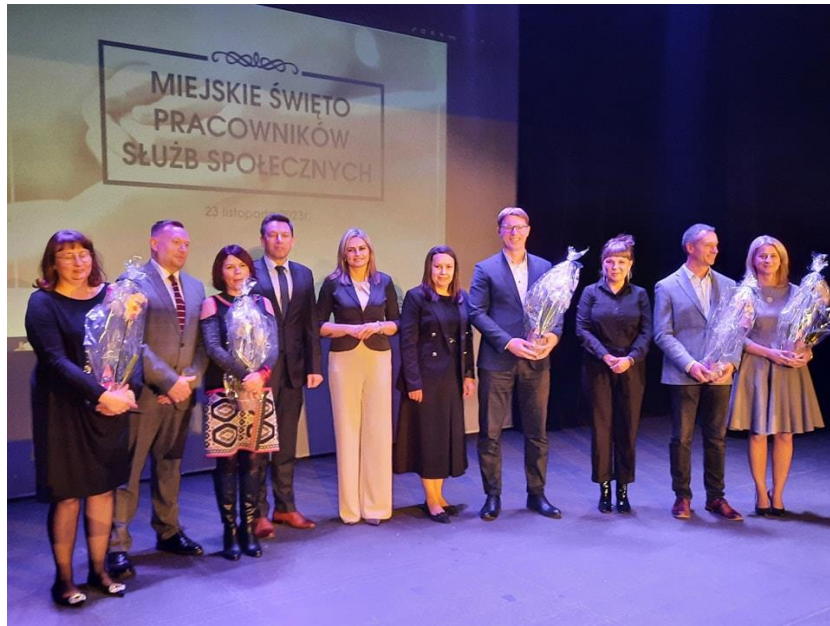
Święto Pracowników Służb Społecznych w Centrum Kultury Śląskiej w Świętochłowicach