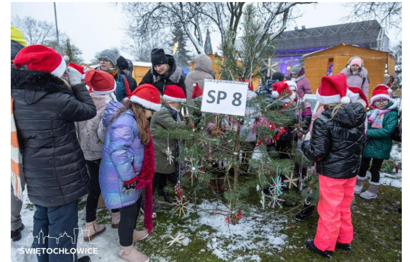
Jarmark Bożonarodzeniowy 2023