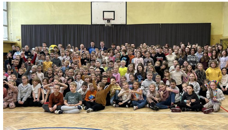
Niebieskie Mikołaje w SP2