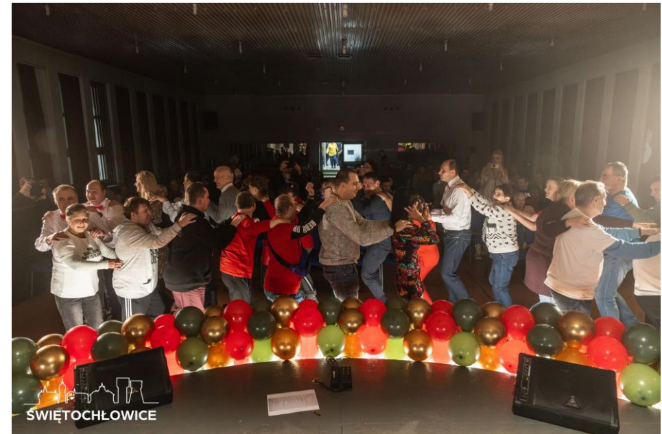
Miejskie Obchody Tygodnia Osób z Niepełnosprawnościami