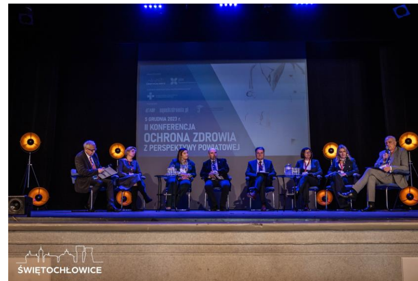
II Konferencja dotycząca Ochrony Zdrowia