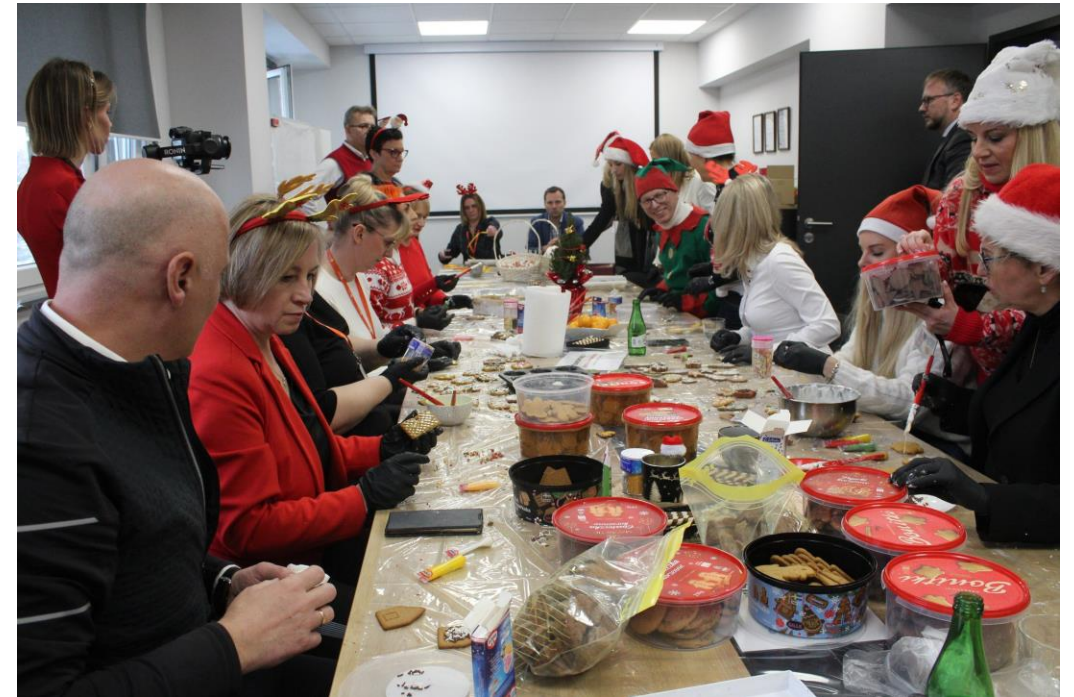
Zdobienie Pierników z pracownikami Huty Pokój w Rudzie Śląskiej