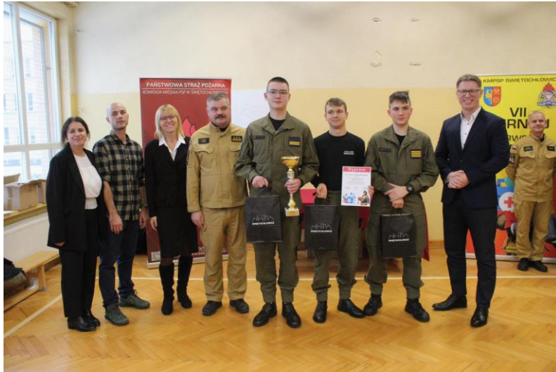
Turniej Pierwszej Pomocy