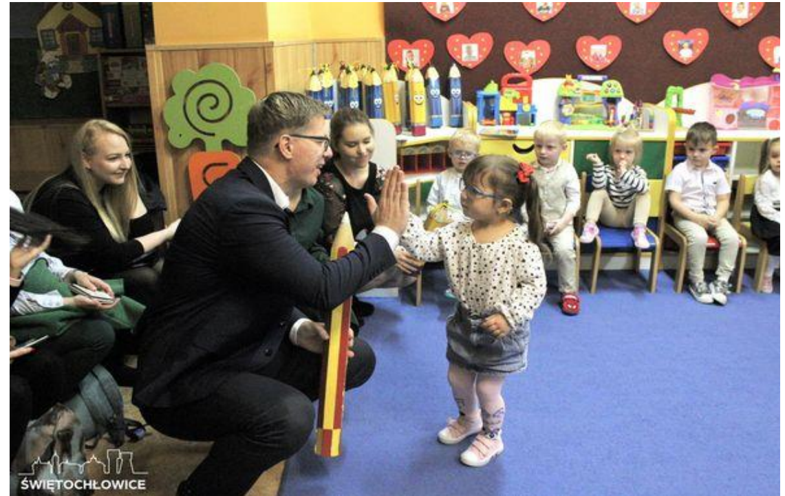
Pasowanie na Przedszkolaka w Przedszkolu Miejskim nr 12 w Świętochłowicach