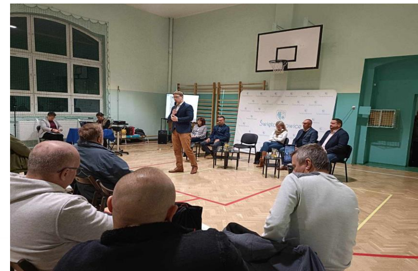
Spotkania z mieszkańcami w dzielnicach