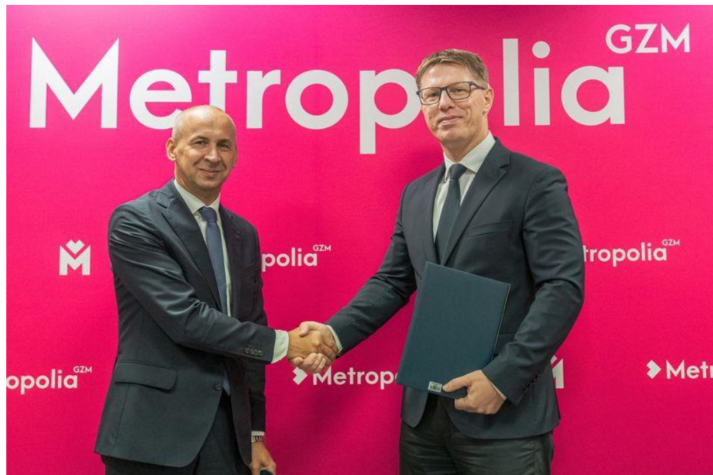
Podpisanie umowy z GZM ws. nieodpłatnego przekazania ok. 3,5% akcji miasta spółce Tramwaje Śląskie