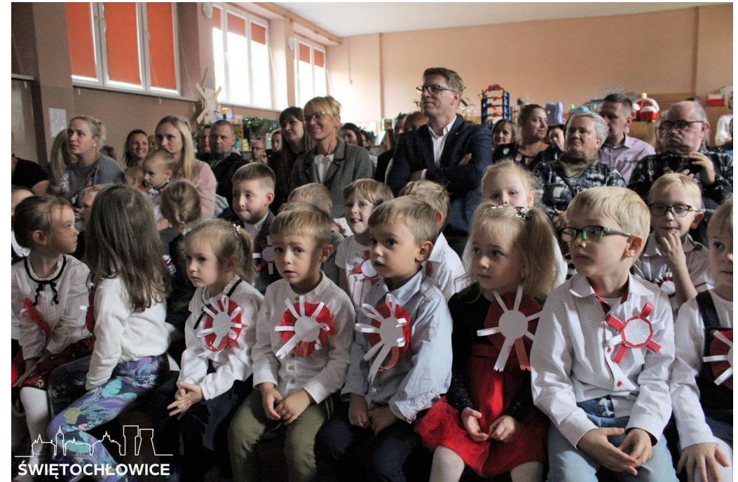
Akademia z okazji Narodowego Święta Niepodległości w Przedszkolu Miejskim nr 11