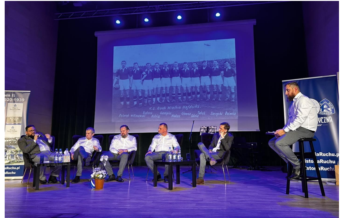
Inauguracja czwartej części historii Ruchu Chorzów