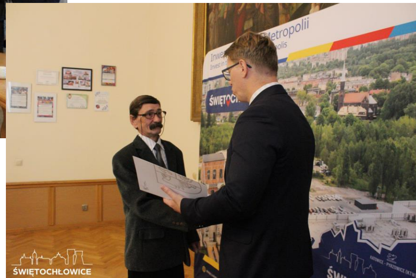
Wręczenie nagród „Złota Rączka”