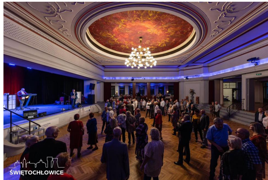
Dzień Seniora w Centrum Kultury Śląskiej