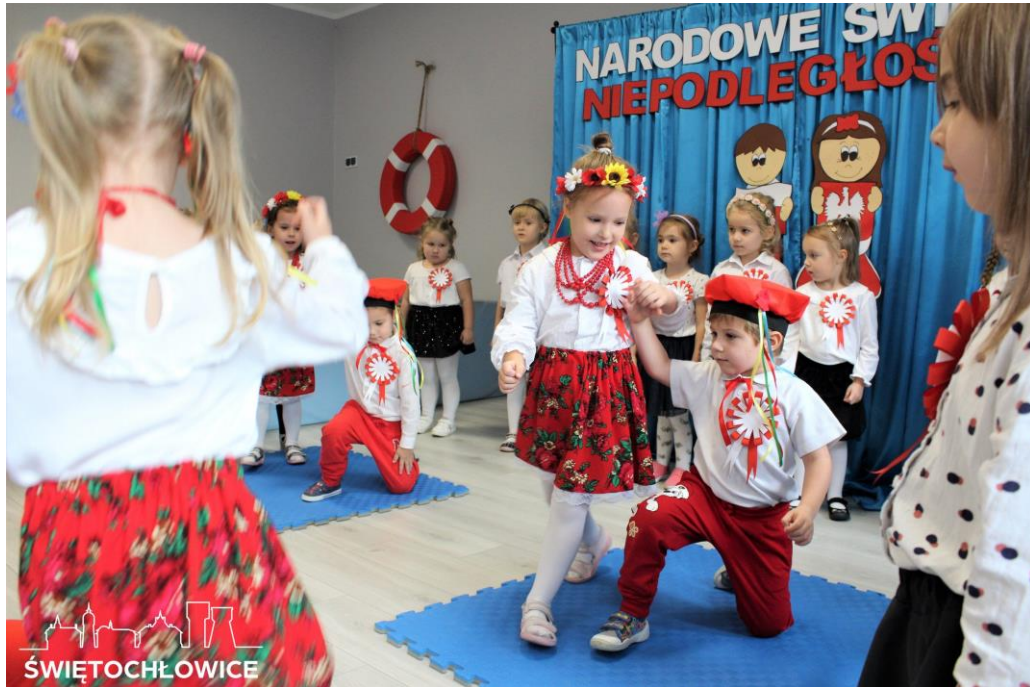
Akademia z okazji Narodowego Święta Niepodległości w Przedszkolu Miejskim nr 4