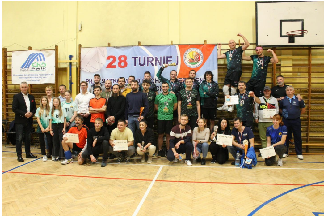
28 Turniej piłki siatkowej o puchar Prezydenta Miasta