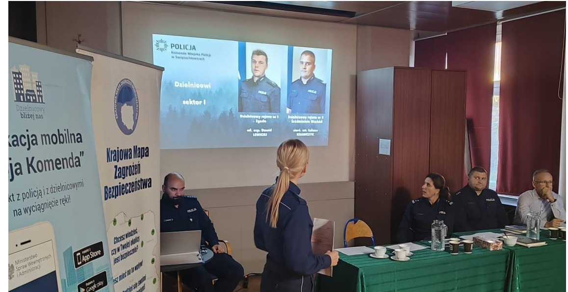
Debata „Odpowiedzialność prawna nieletnich”