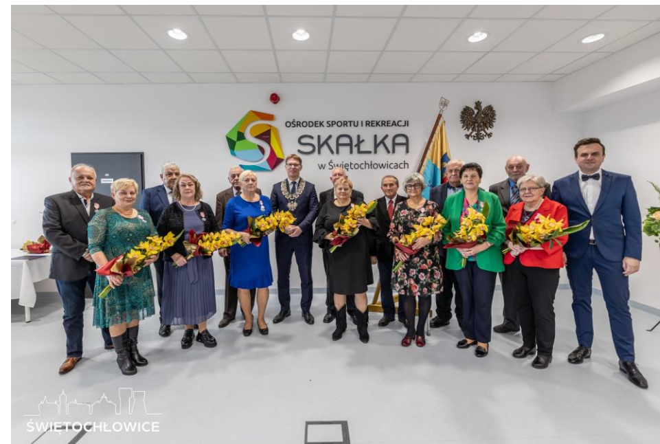
Złote i Diamentowe Gody