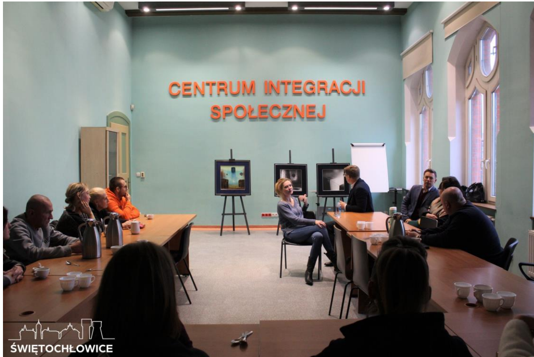
Warsztaty – Sztuka na spacerze