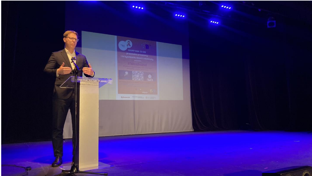
Kampania 19 dni przeciwko przemocy