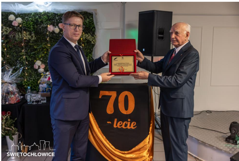
70 – lecie PZERI w Świętochłowicach