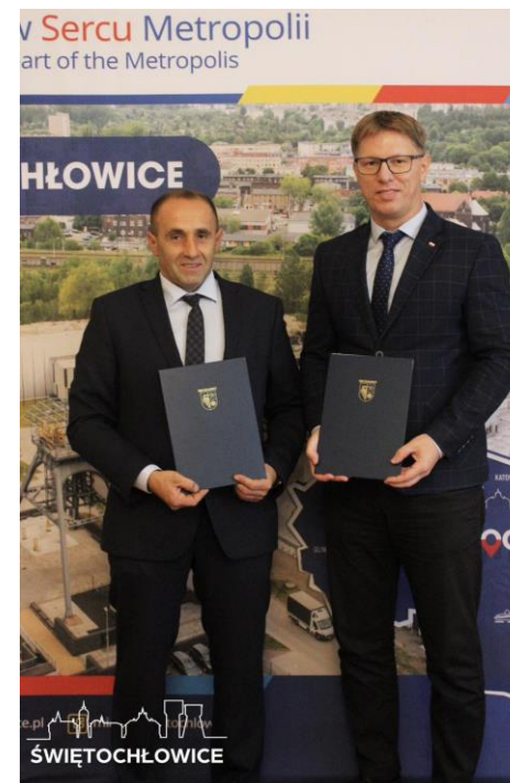
Podpisanie umowy z firmą Budex na kolejny etap modernizacji oświetlenia zewnętrznego na terenie OSiR Skąłka