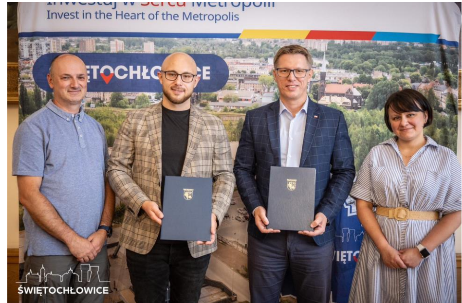
Podpisano umowę dot. Zagospodarowania terenu przy Szkole Podstawowej nr 4 im. Tadeusza Kościuszki w Świętochłowicach oraz dostosowania budynku PM 2 do obowiązujących wymagań z zakresu ochrony przeciwpożarowej