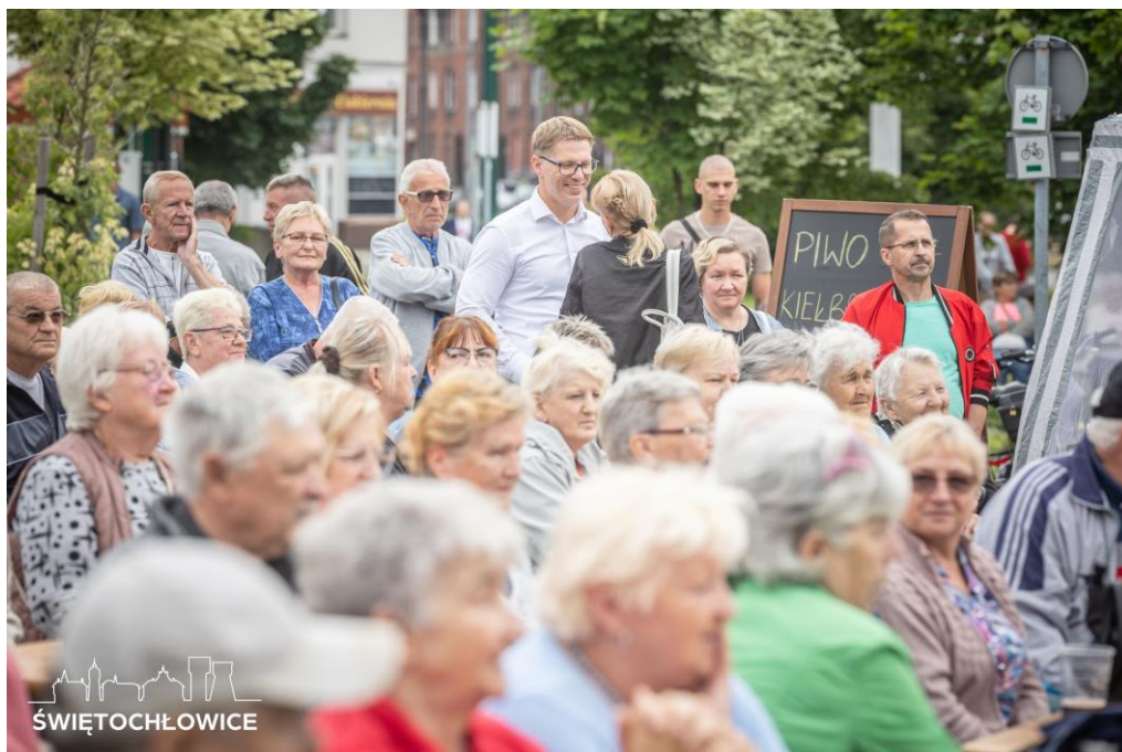
Festyn dzielnicowy Lipiny