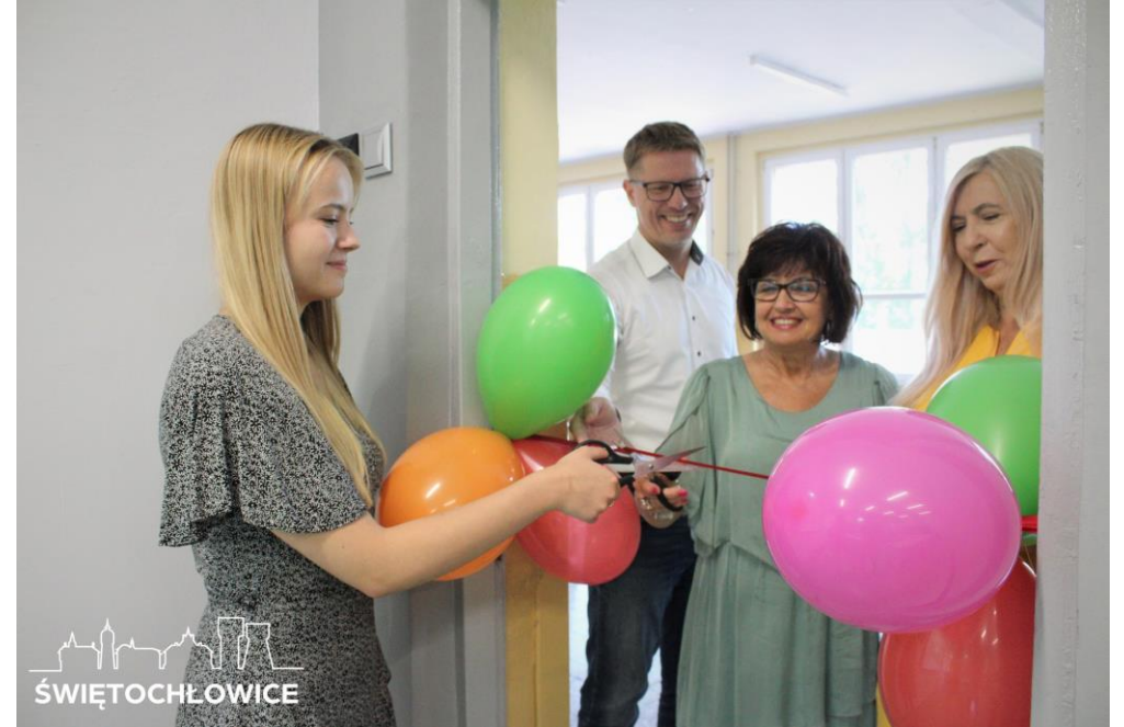
Otwarcie sali językowej w I LO z Oddziałem Dwujęzycznymi Im. J. Kochanowskiego