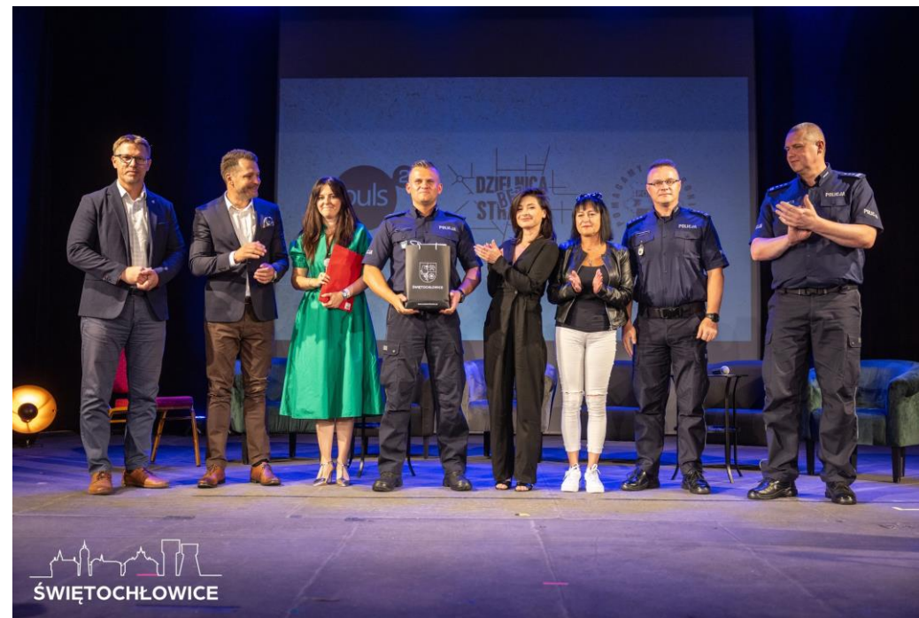
Konferencja Dzielnic Strachu – Super Dzielnicowy