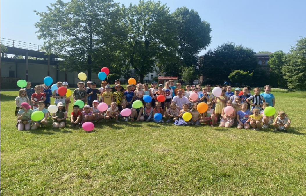
Zakończenie roku akademickiego Uniwersytetu Dziecięcego Akademii WSB