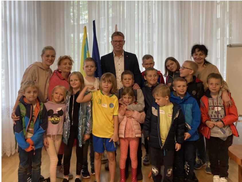
Odwiedziny dzieci w gabinecie prezydenta w ramach akcji wakacje z Centrum Kultury Śląskiej