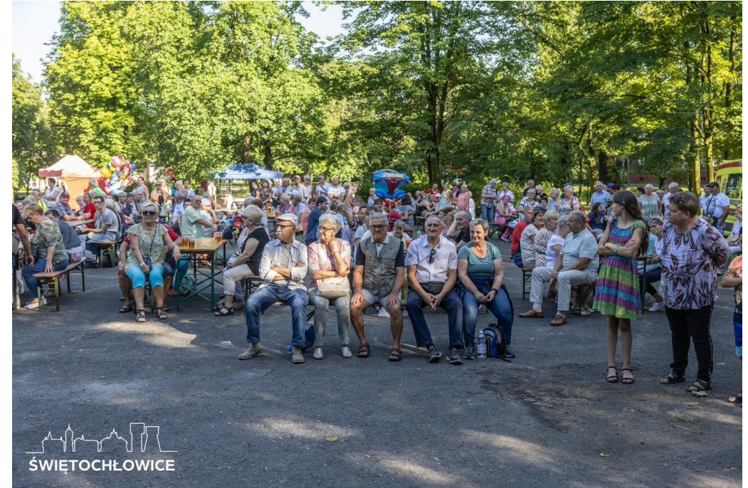
Festyn dzielnicowy Centrum