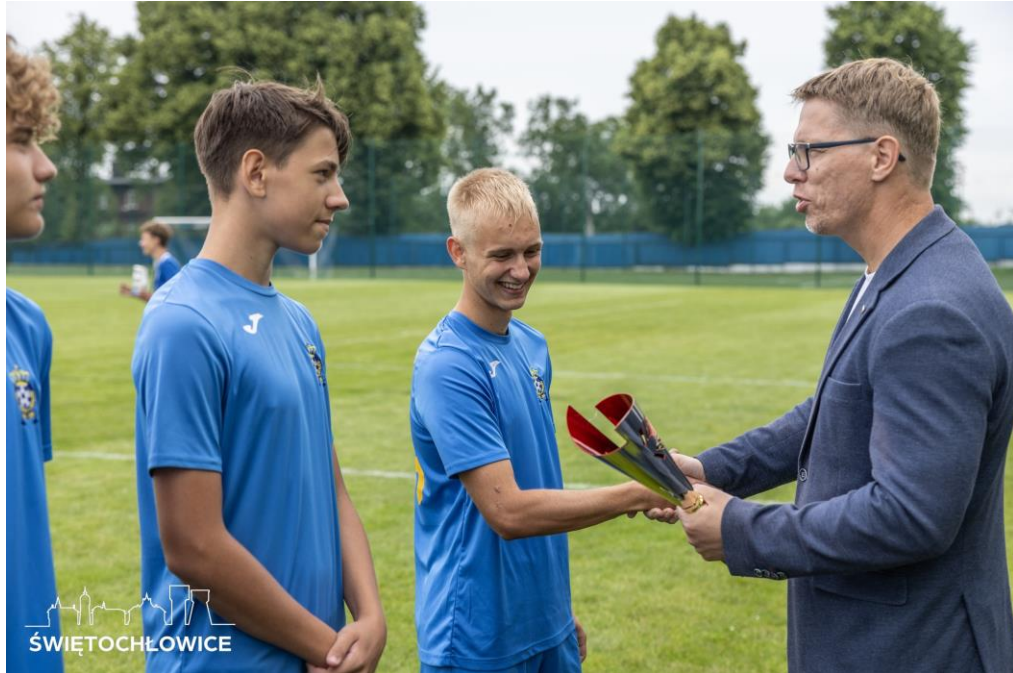
Turniej piłki nożnej na stadionie ŚKS Naprzód Lipiny