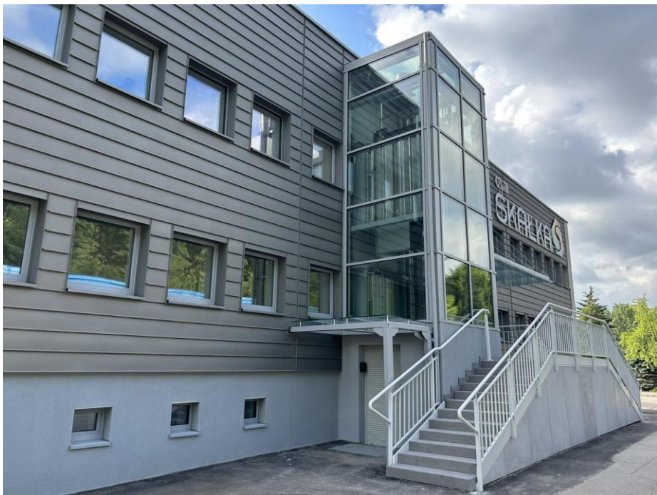
Odbiory budynku OSiR Skalka;