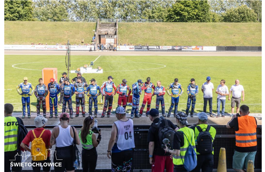
Zawody żużlowe Nice Cup na Stadionie im. Pawła Waloszka