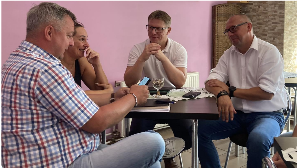
Wakacyjne spotkanie z mieszkańcami – rozmowy offline