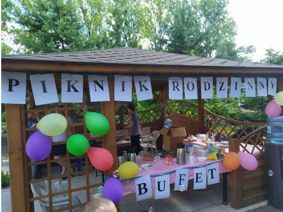
Festyn rodzinny Złota Jesień