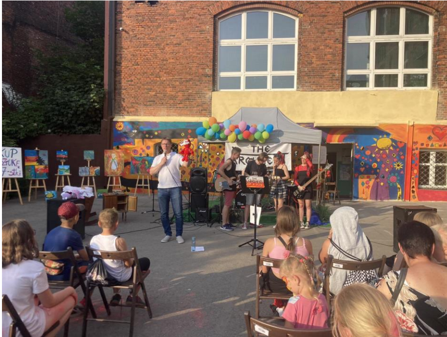
Festyn szkolny w Szkole Podstawowej z Oddziałami Integracyjnymi nr 17 w Świętochłowice