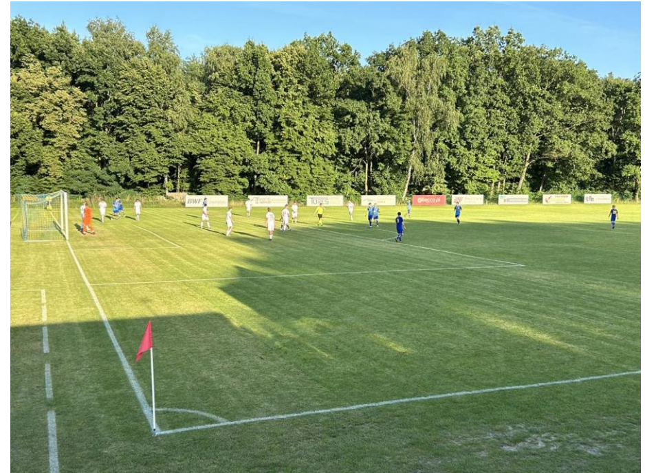
Mecz MKS Śląsk DEMARKO Świętochłowice