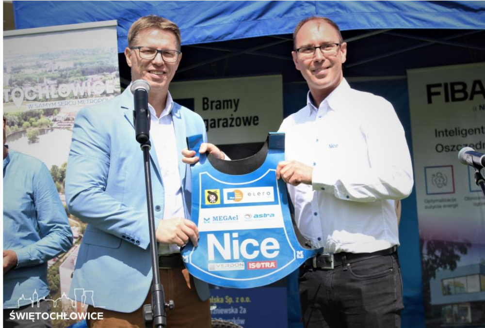
Konferencja prasowa dot. Zawodów Nice Cup