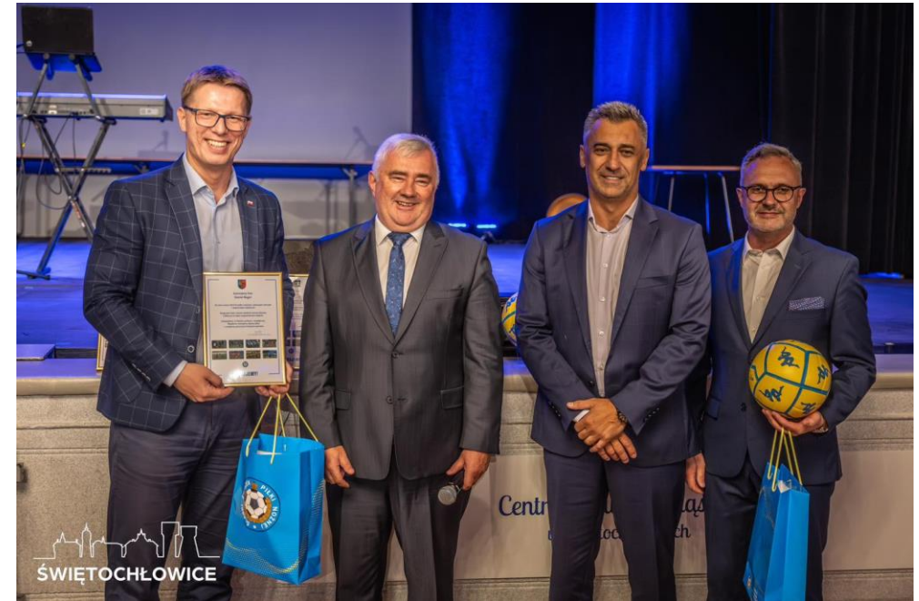
Nadzwyczajne Wolne Zgromadzenie Delegatów Śląskiego Związku Piłki Nożnej