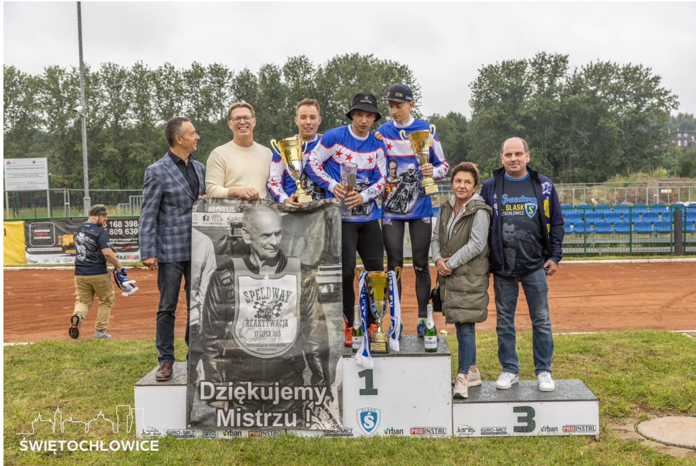
Zawody speedrowerowe – memoriał im. Pawła Waloszka