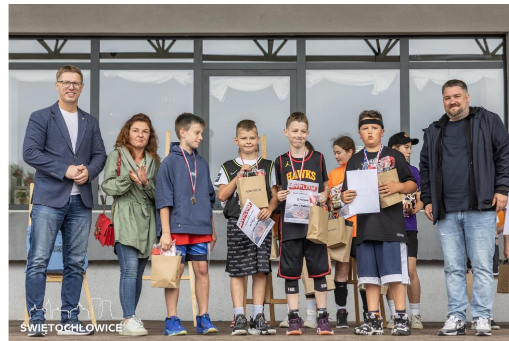
Powitanie lata na OsiR Skałka