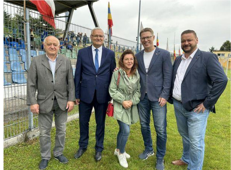
III Turniej Piłkarskiego – Memoriał Rainharda Piontka