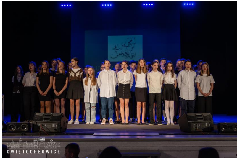
Przedstawienie z „Europą za pan brat”