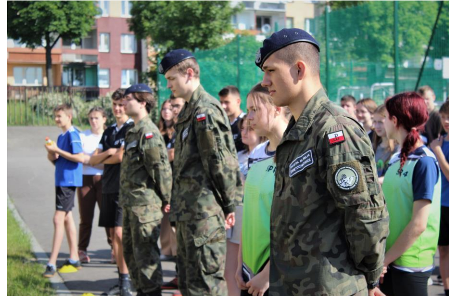
Turniej sportowo-wojskowy organizowany przez ZSO Świętochłowice