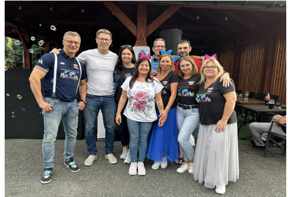
Wydarzenie charytatywne organizowane przez stowarzyszenie Wszyscy Razem Wszyscy Równi