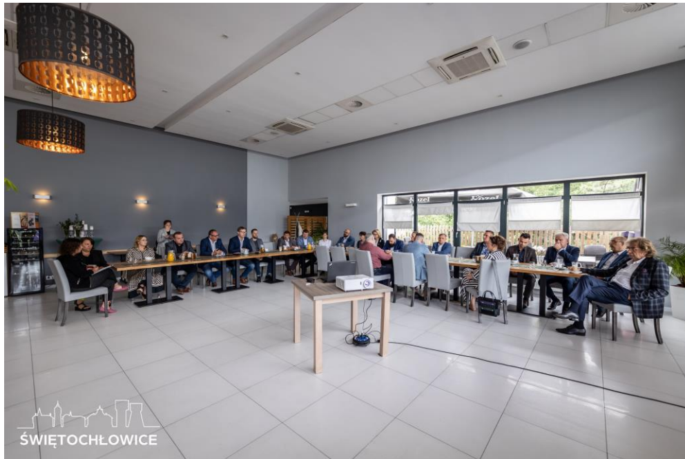
Rada Biznesu – czerwiec 2023