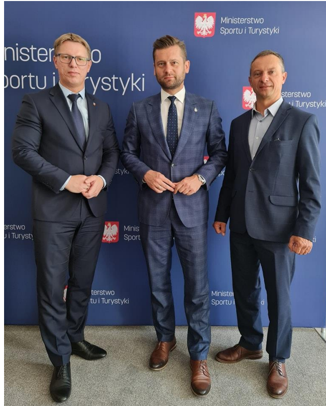
Spotkanie z Ministrem Sportu, Kamilem Bortniczukiem