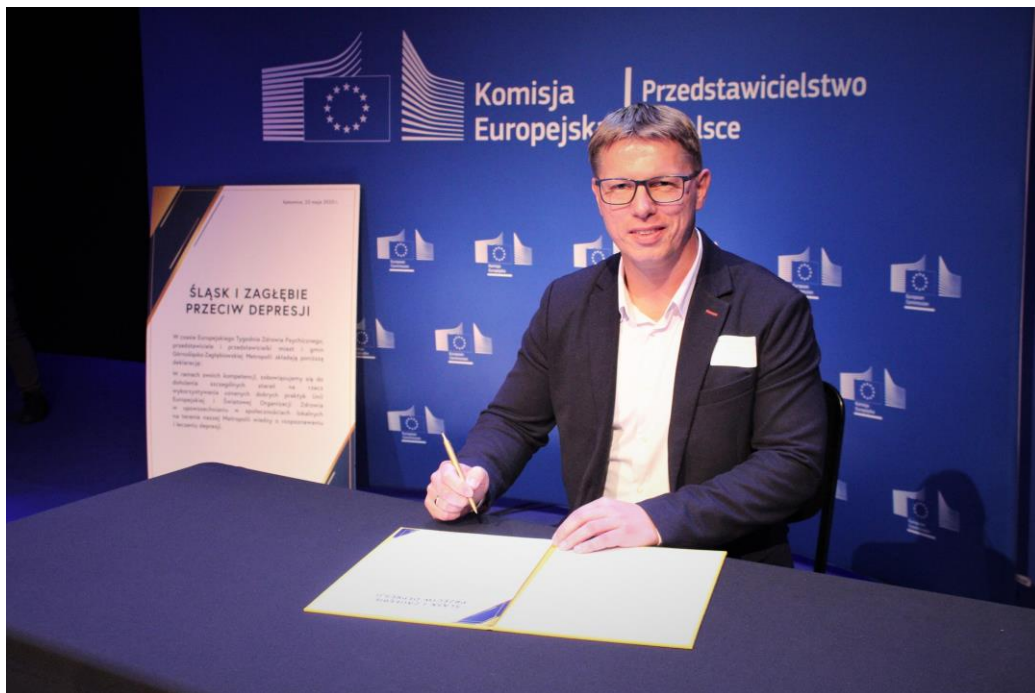
Konferencja „Śląsk i Zagłębie przeciw depresji”