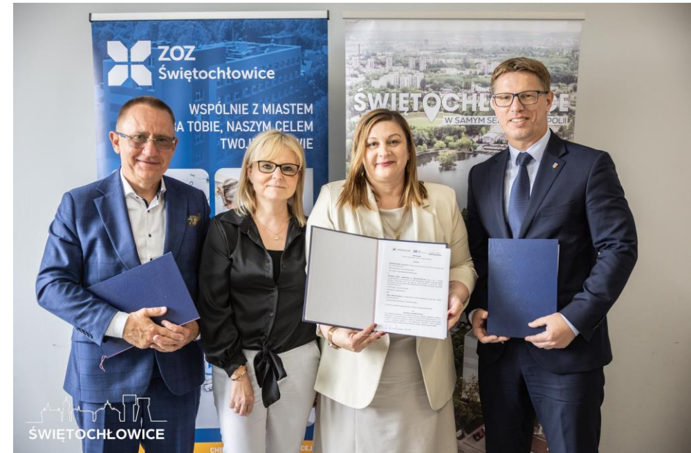
Podpisano list intencyjny z Akademią Śląską, dzięki której studenci kierunków medycznych będą mogli uczyć się zawodu w Zespole Opieki Zdrowotnej w Świątchłowicach