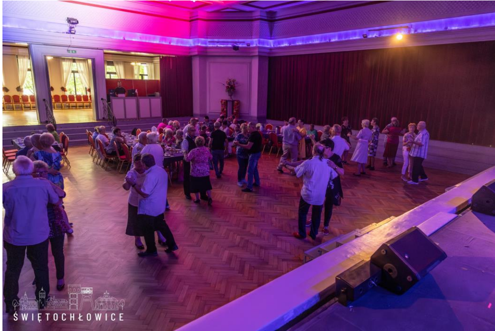
Ostatnia potańcówka dla seniorów w tym sezonie