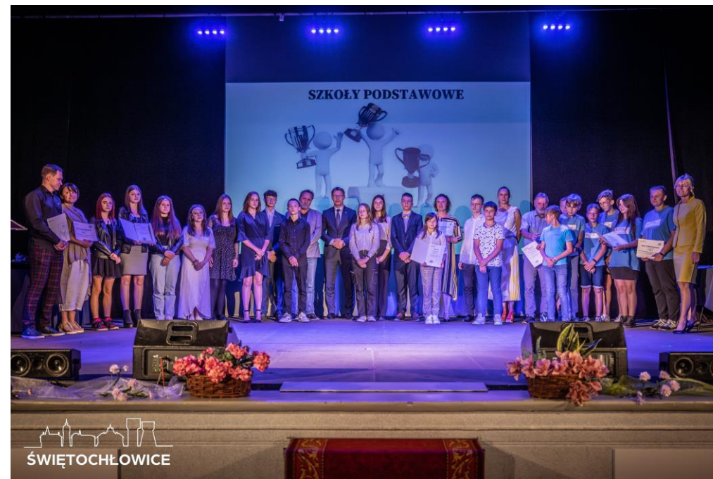
III Edycja konkursu „Młodzi Kreatywni”