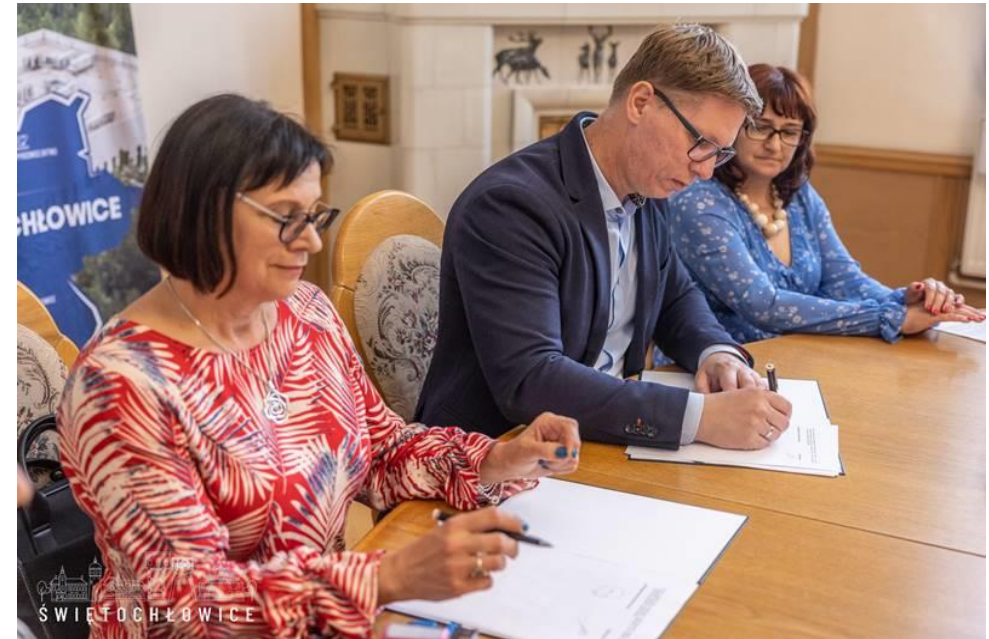
Podpisano umowę na rewitalizację Parku Jordanowskiego