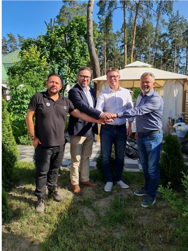
Wyjazd na Ukrainę z Fundacją Wolne Miejsce