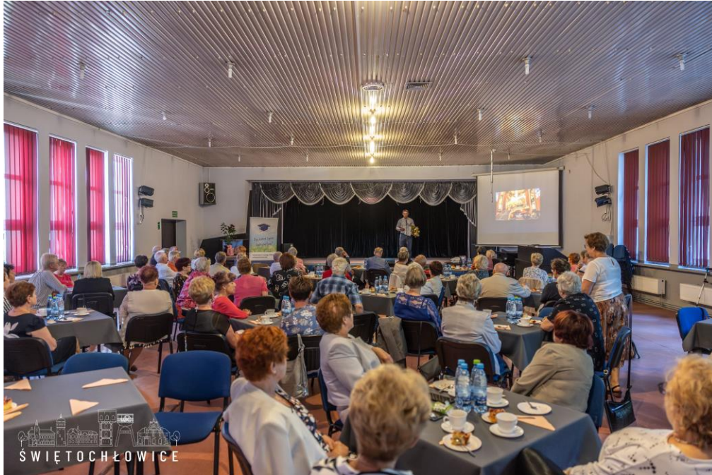
Zakończenie roku akademickiego Uniwersytetu Trzeciego Wieku