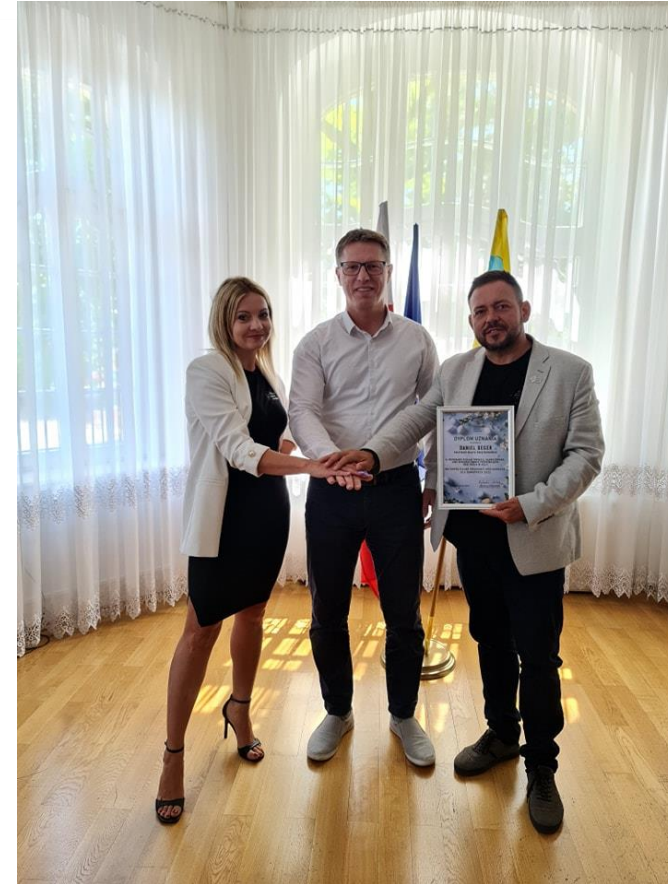
Spotkanie z zarządem fundacji Wolne Miejsce