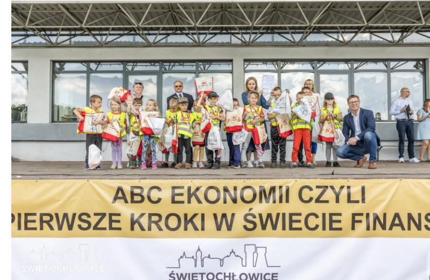
Projekt ABC Ekonomii