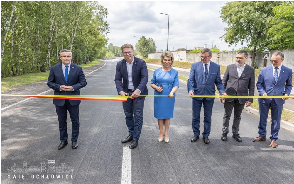
Otwarto nowy zjazd z DTŚ oraz ul. Przemysłową