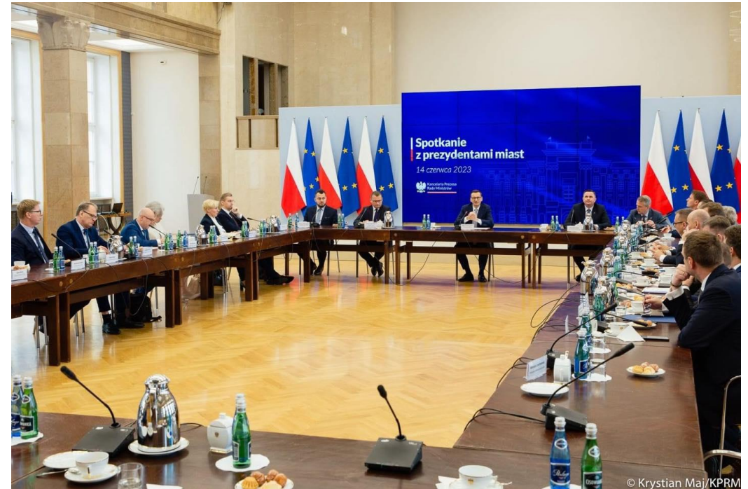
Spotkanie prezydentów miast z Prezesem Rady Ministrów, Mateuszem Morawieckim