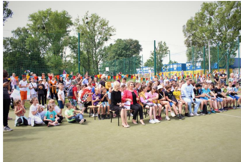
Dzień Śląski w Szkole Podstawowej nr 19