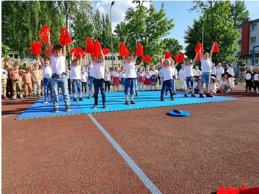
Festyn rodzinny „Dzieci z wszystkich stron świata”