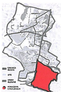
Lokalizacja na planie miasta