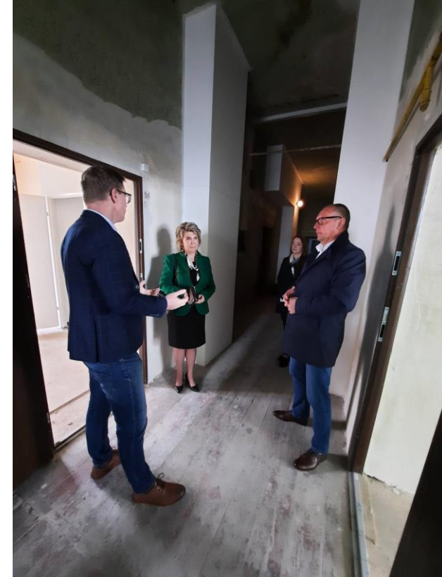
Oddanie ponad 30 mieszkań ze zmodernizowanymi sanitariatami po ich likwidacji z klatek schodowych