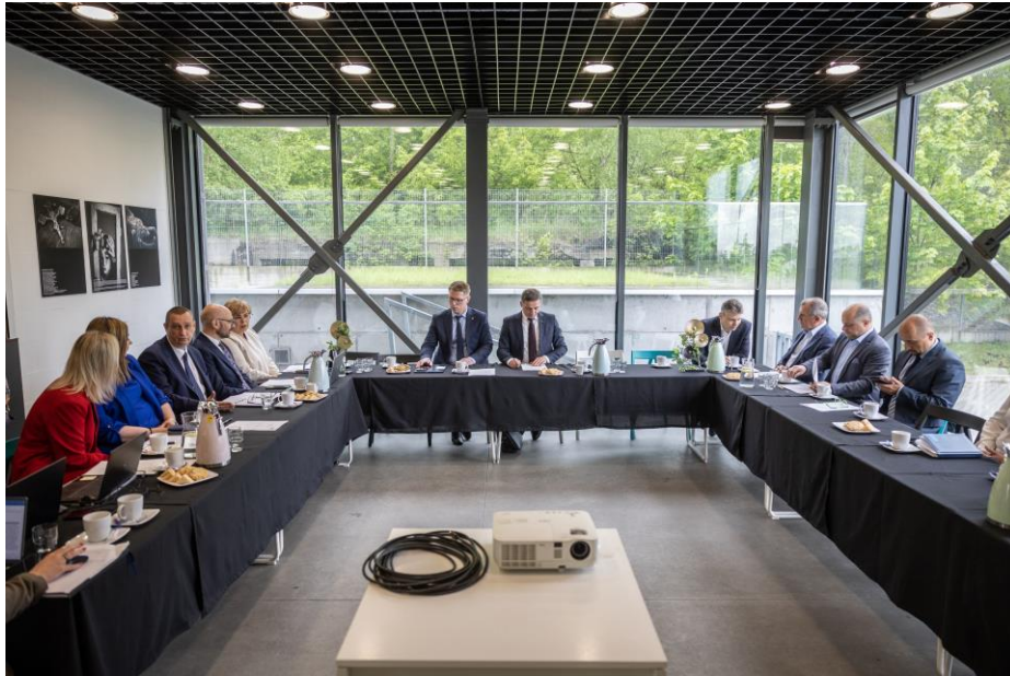
Konwent Prezydentów Miast na Prawach Powiatu