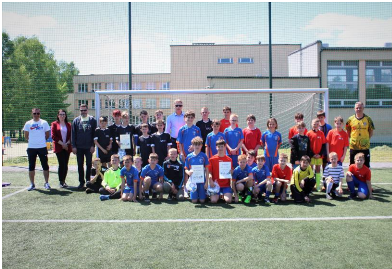
Miejski Turniej piłki nożnej chłopców ze szkół podstawowych klas IV-VI W ZSO w Świętochłowicach