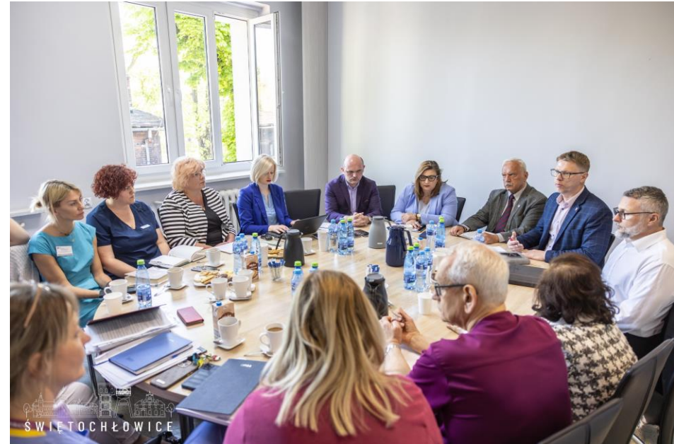
Spotkanie z zespołem roboczym ds. uzdrowienia sytuacji ZOZ