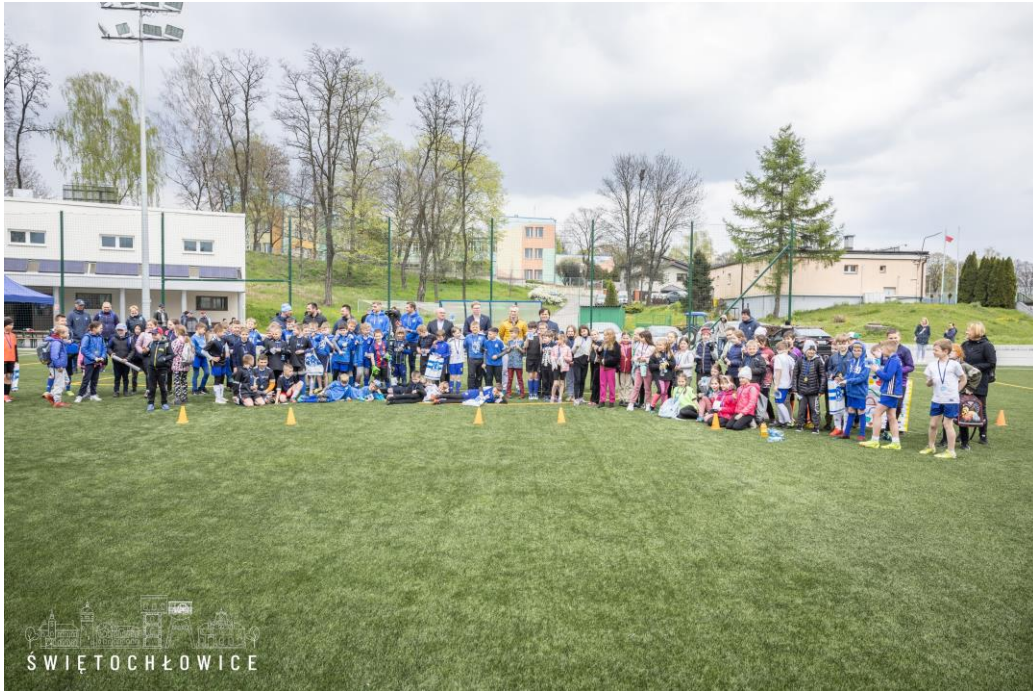
Turniej z okazji 103-lecia Ruchu Chorzów