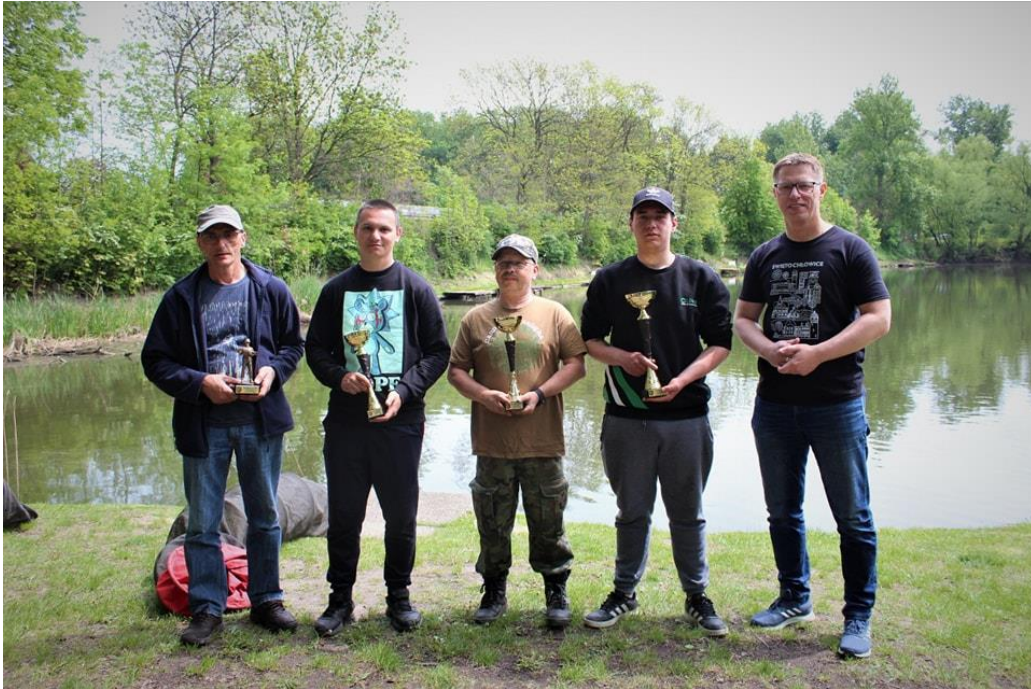
Kolejna wędkarska edycja ligi sławikowej – „Wąwóz”