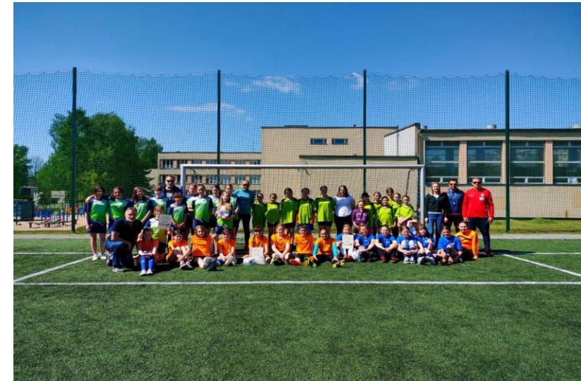
Miejskie Zawody w Piłce Nożnej dziewczyn na boiskach ZSO w Świętochłowicach