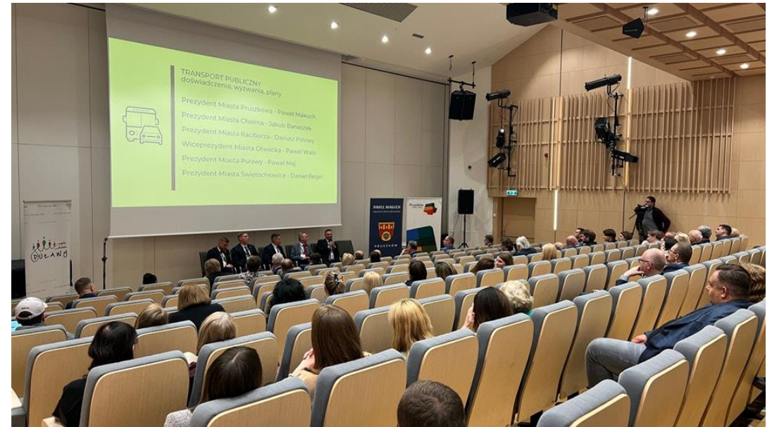
Konferencja pt. „Porozmawiajmy o Samorządzie” organizowana w Pruszkowie