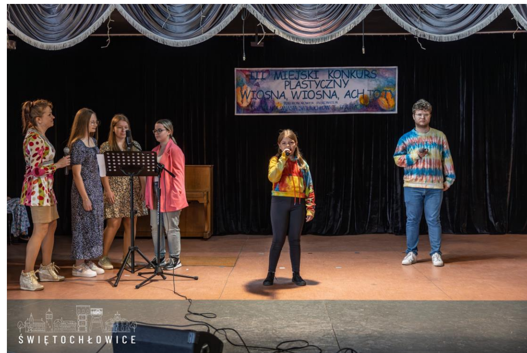
Trzeci Miejski konkurs plastyczny pt. „Wiosna, wiosna ach to ty”