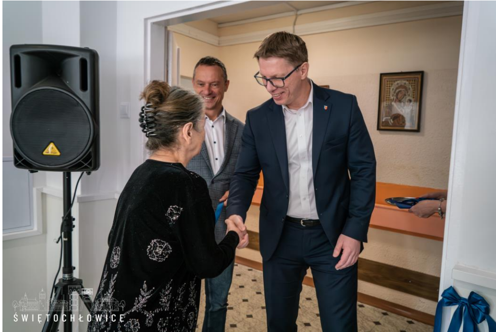
Otwarcie odremontowanej świetlicy w Złotej Jesieni w Świętochłowicach