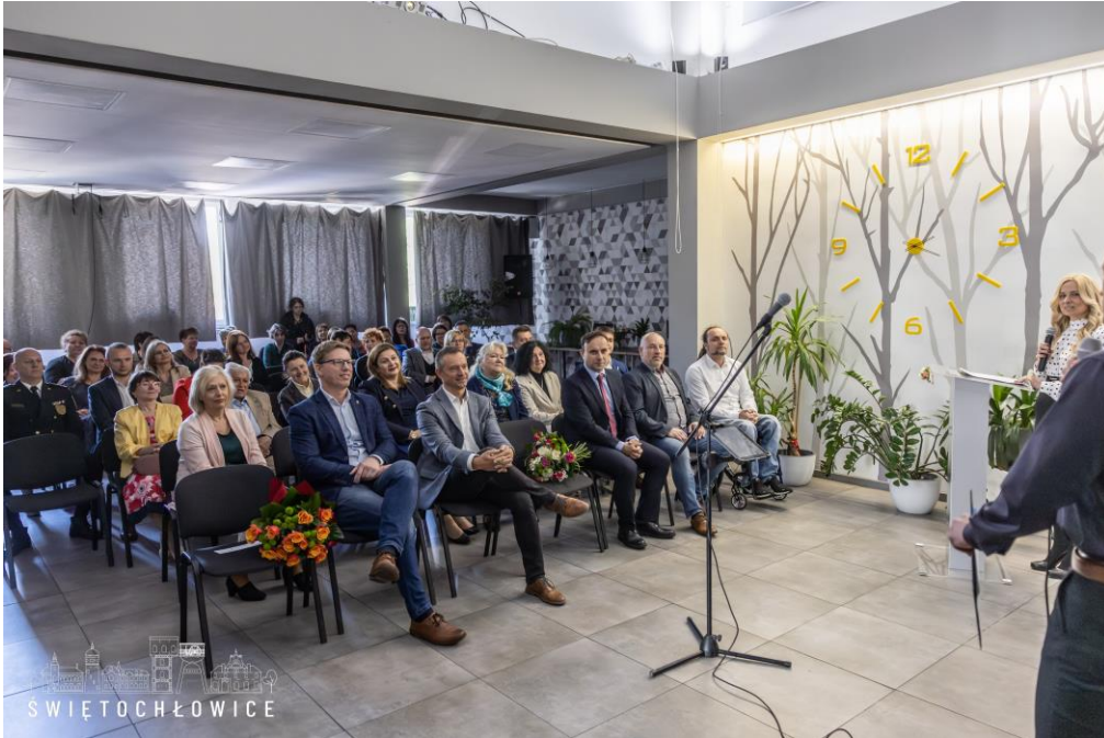
Jubileuszu 75-lecia istnienia Miejskiej Biblioteki Publicznej