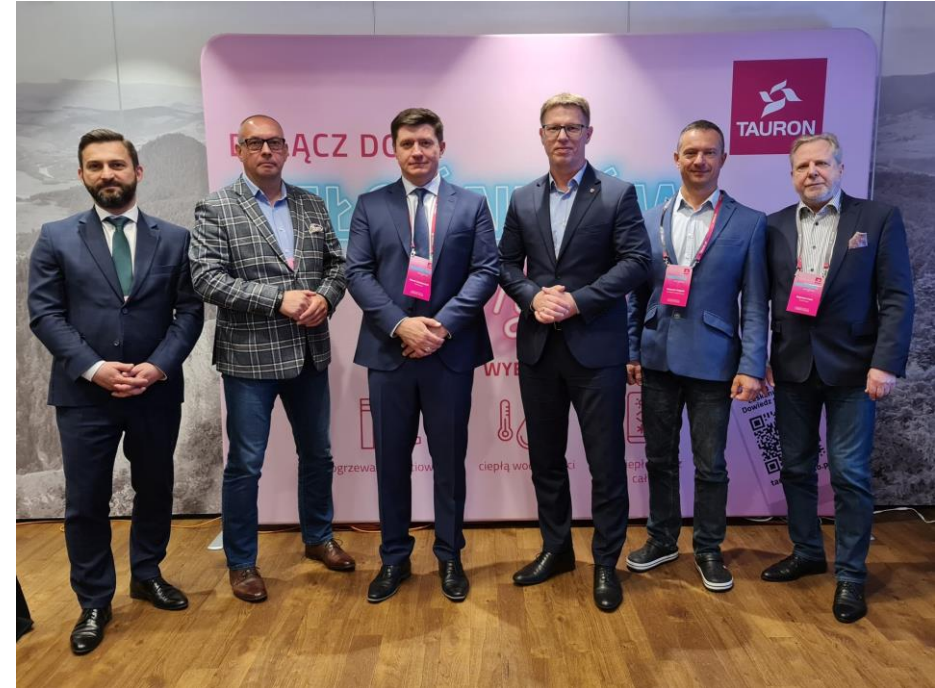
Spotkanie z zarządem Tauron Ciepło