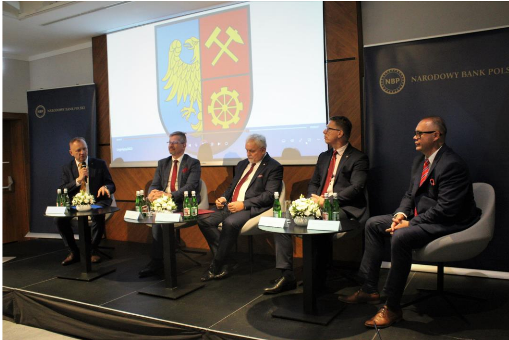
Panel samorządowy zorganizowany przez Narodowy Bank Polski w Katowicach