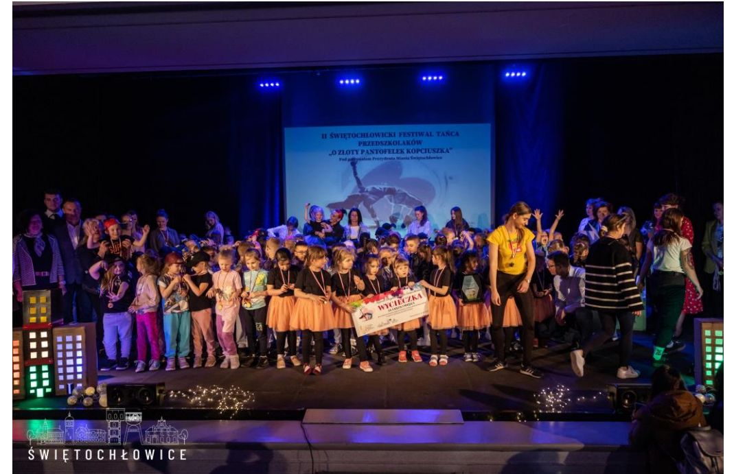
Świętochłowski Festiwal Tańca przedszkolaków „O Żłoty Pantofelek Kopciuszką”