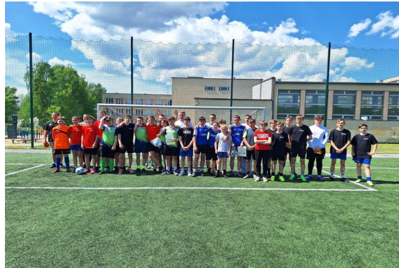
Miejski Turniej piłki nożnej chłopców klas VII i VIII w ZSO w Świętochłowicach