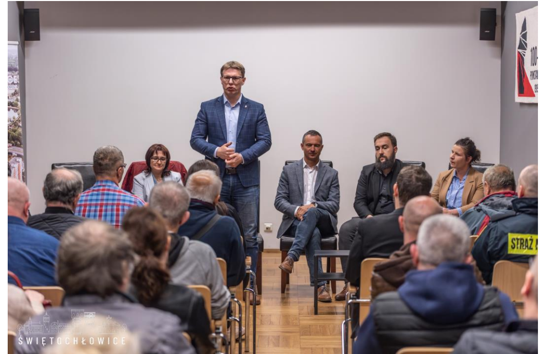
Spotkanie z mieszkańcami w dzielnicy Centrum oraz Zgoda