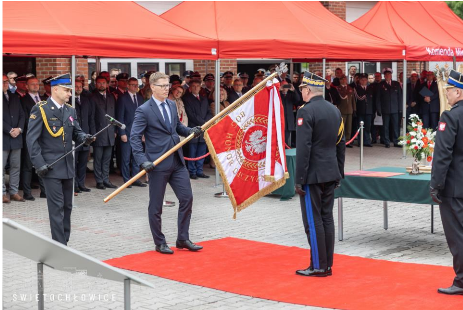
Uroczyste nadanie Sztandaru Państwowej Straży Pożarnej