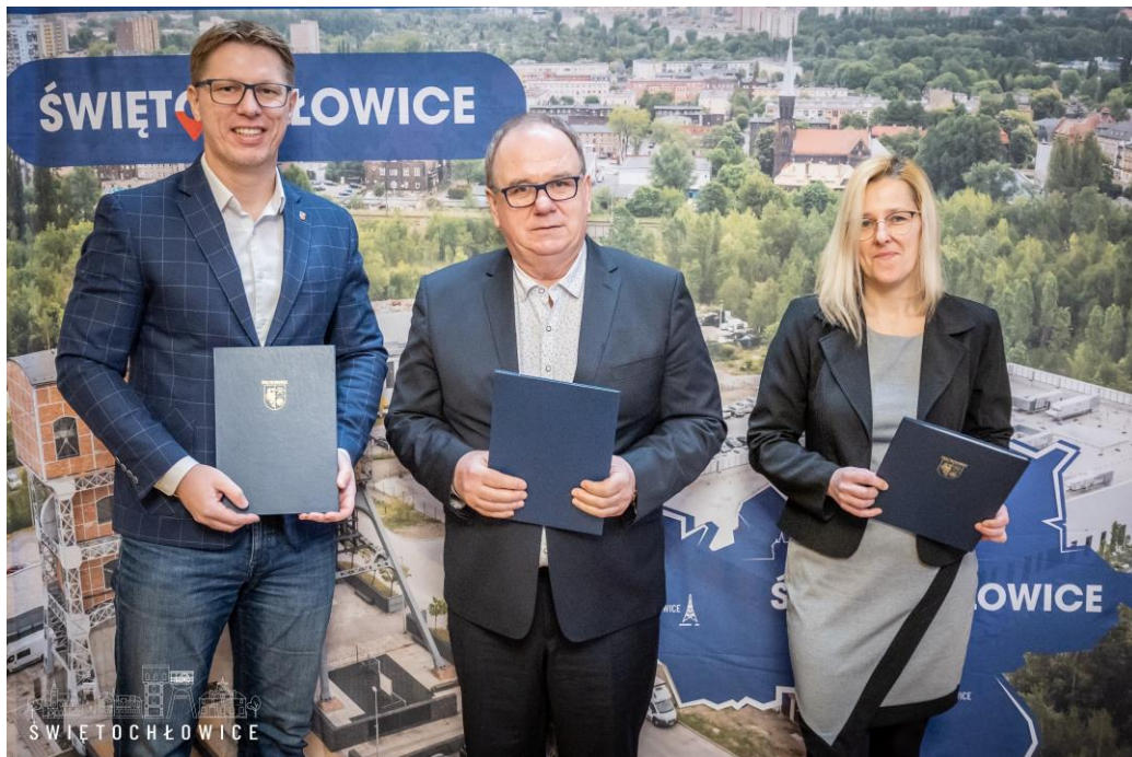
Podpisanie umowy na remont ulicy Katowickiej z firmą Novum Stone Expert Sp. z o.o.