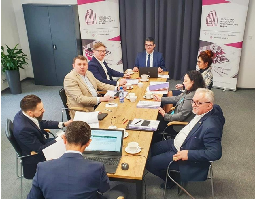
Zgromadzenie Wspólników SIM Śląsk