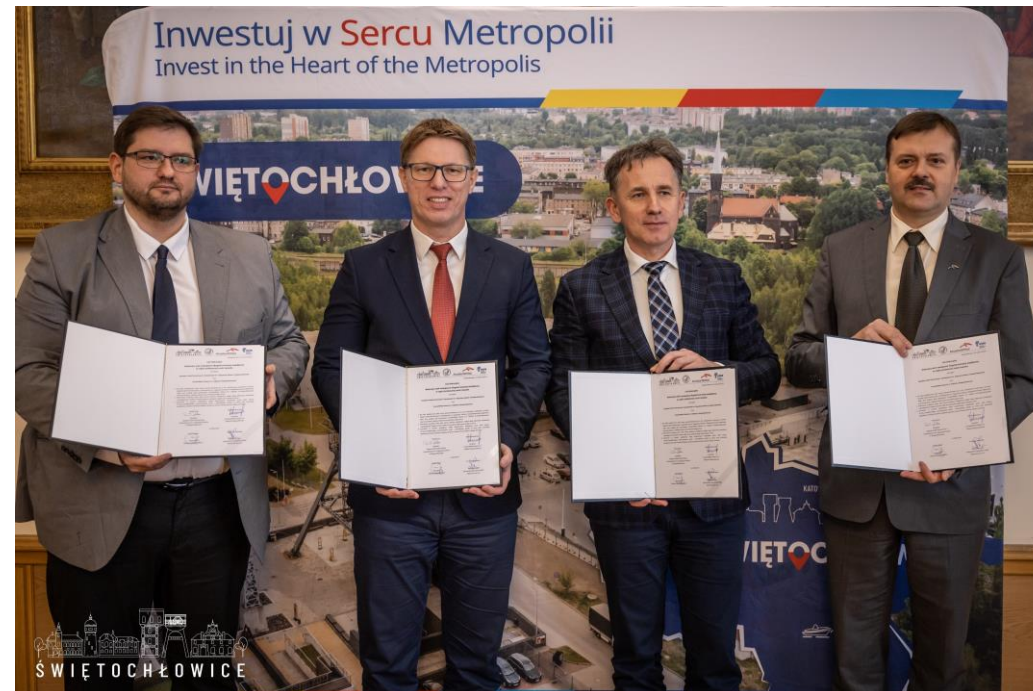
Podpisanie umowy o współpracy pomiędzy Zespołem Szkół Technicznych i Zawodowych im. A. Świdra w Świętochłowicach a ArcelorMittal Poland