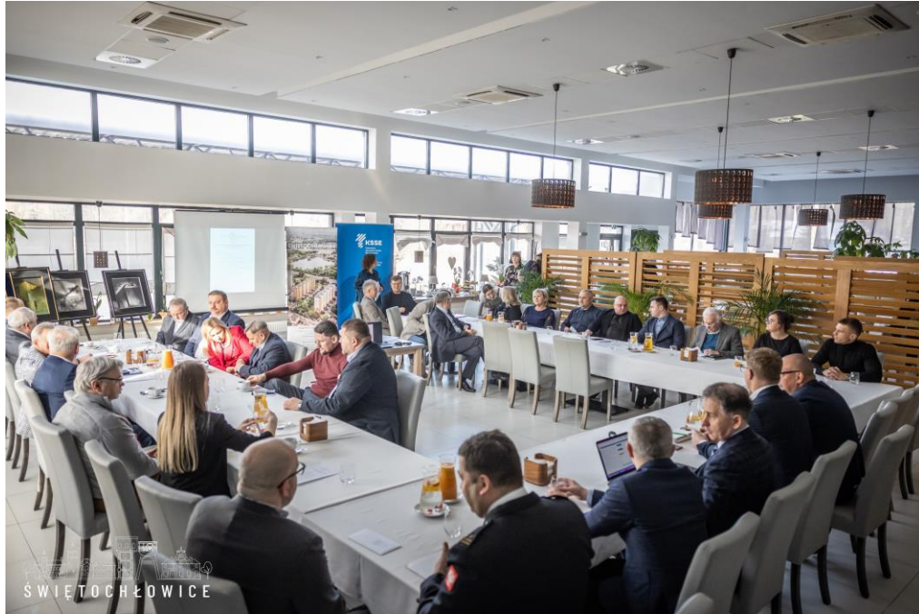
Posiedzenie Rady Biznesu