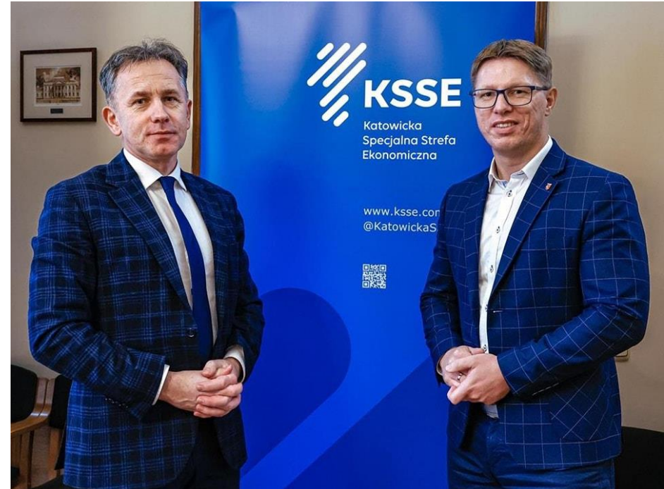
Spotkanie dla przedsiębiorców „KSSE w każdej gminie”