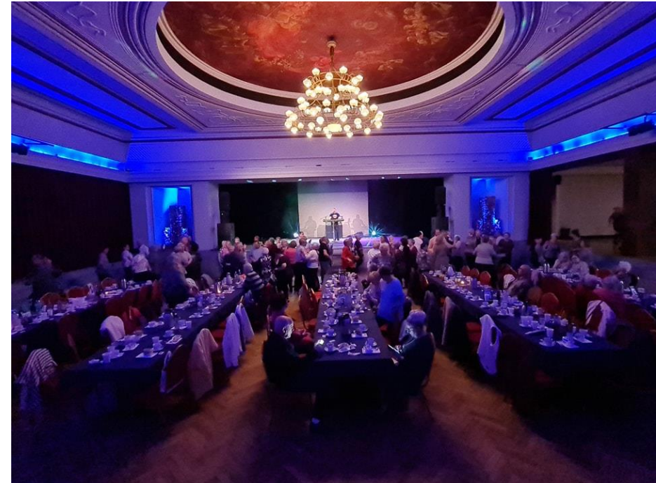
Potańcówka dla seniorów w Centrum Kultury Śląskiej