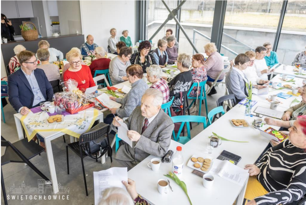
Muzyczne poranki seniorów na Wieżach KWK Polska