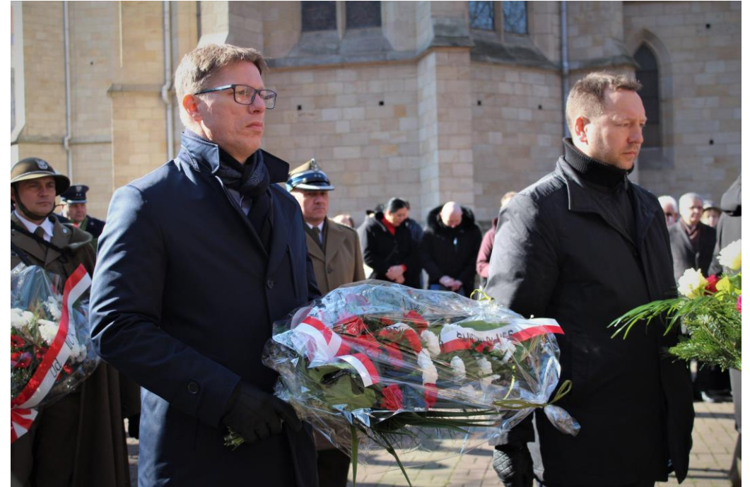
Uroczystość z okazji Dnia Żołnierzy Wyklętych w Katowicach