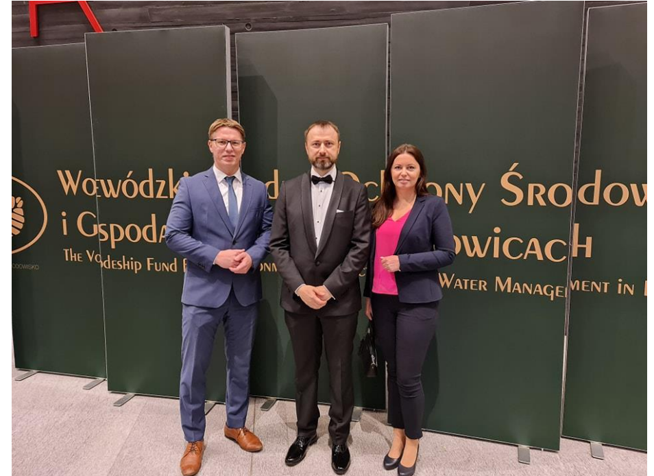
Jubileusz 30-lecia Wojewódzkiego Funduszu Ochrony Środowiska i Gospodarki Wodnej w Katowicach