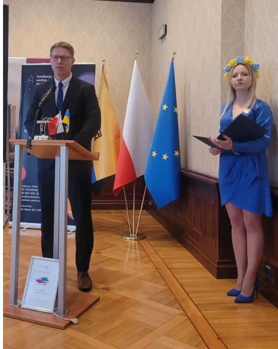
Konferencja „Wolne miejsce dla Ukrainy”