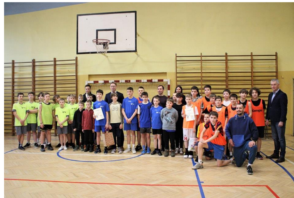
Turniej w piłce koszykowej