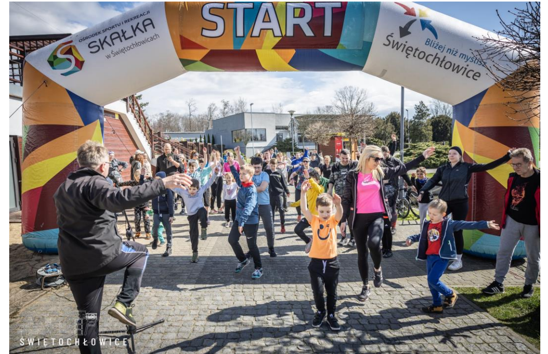
Wiosenny bieg rekreacyjny oraz gra terenowa na terenie OSiR „Skalka”