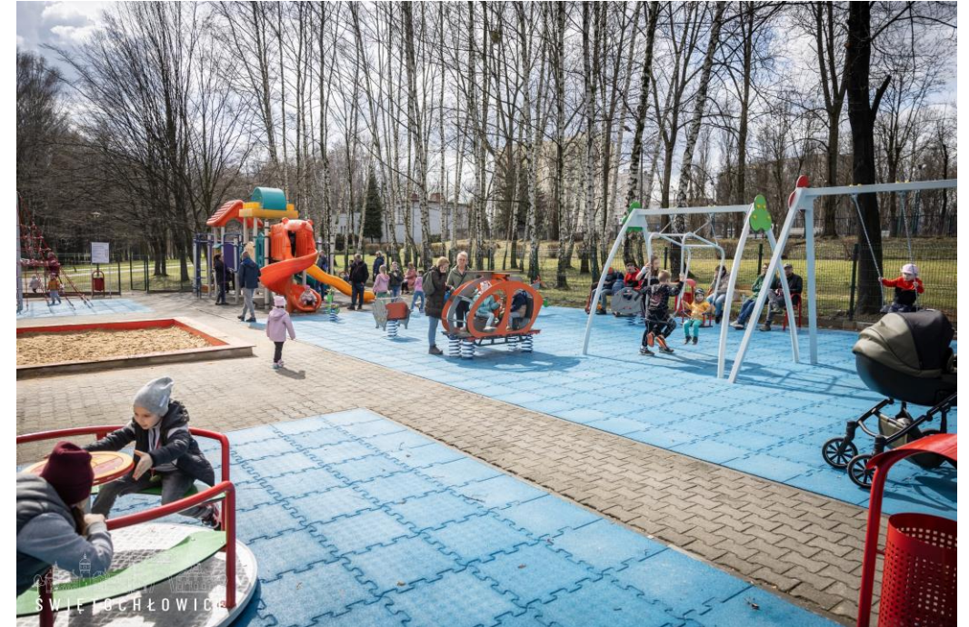
Otwarcie placu zabaw wyremontowanego w ramach środków Budżetu Obywatelskiego na terenie OSiR „Skalka”