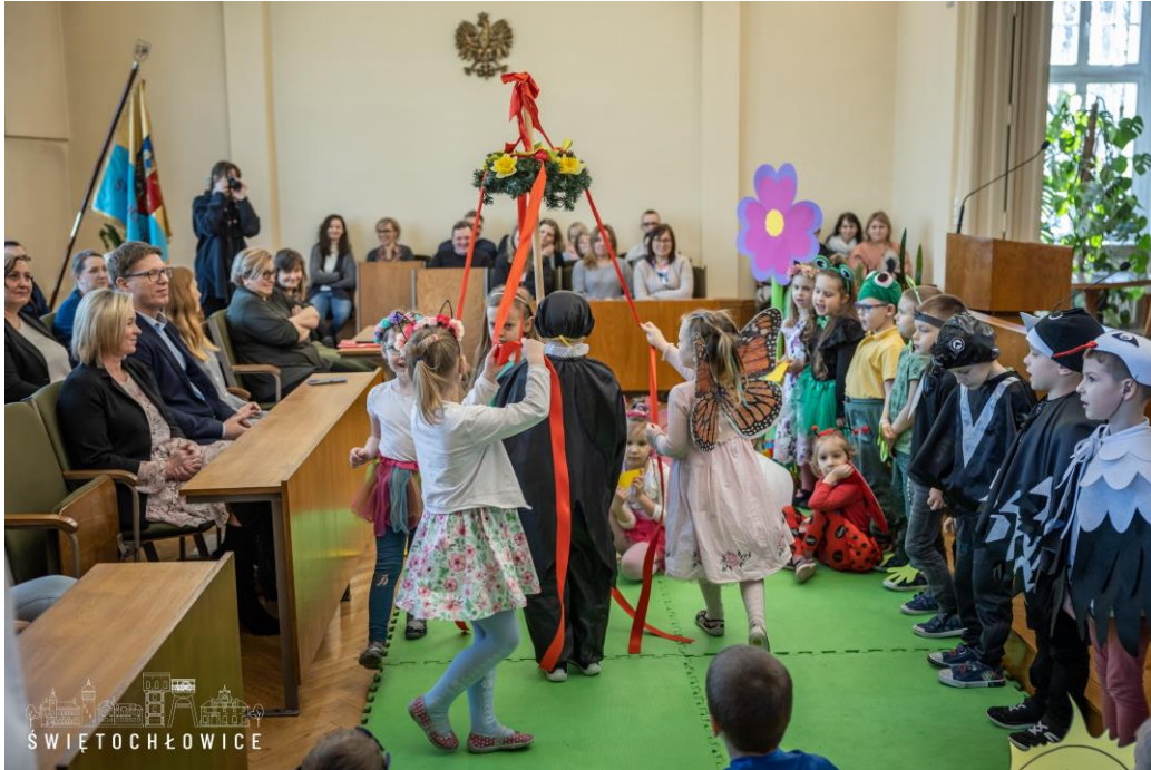
Powitanie wiosny w Urzędzie Miejskim przez dzieci z Przedszkola Miejskiego nr 4