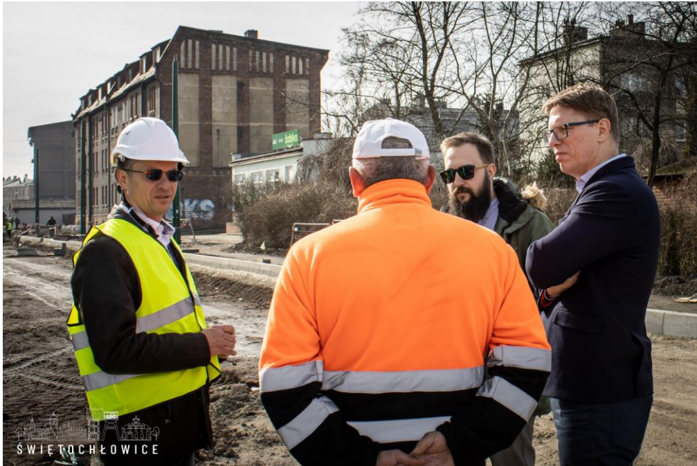
Wizytacje inwestycji miejskich