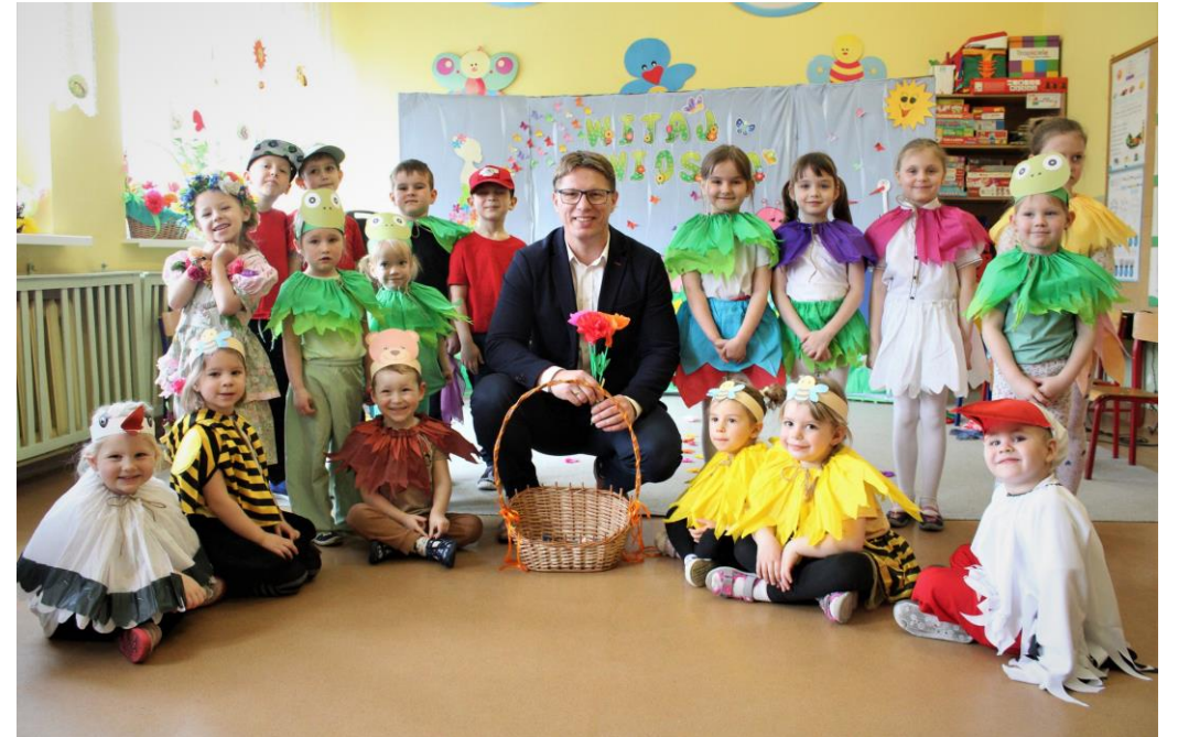
Powitanie wiosny przez przedszkolaki z Przedszkola Miejskiego nr 7 w Świętochłowicach