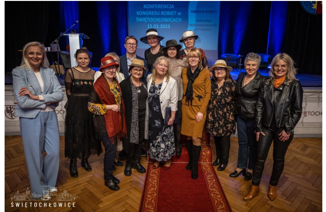
Kongres Kobiet Województwa Śląskiego w Centrum Kultury Śląskiej