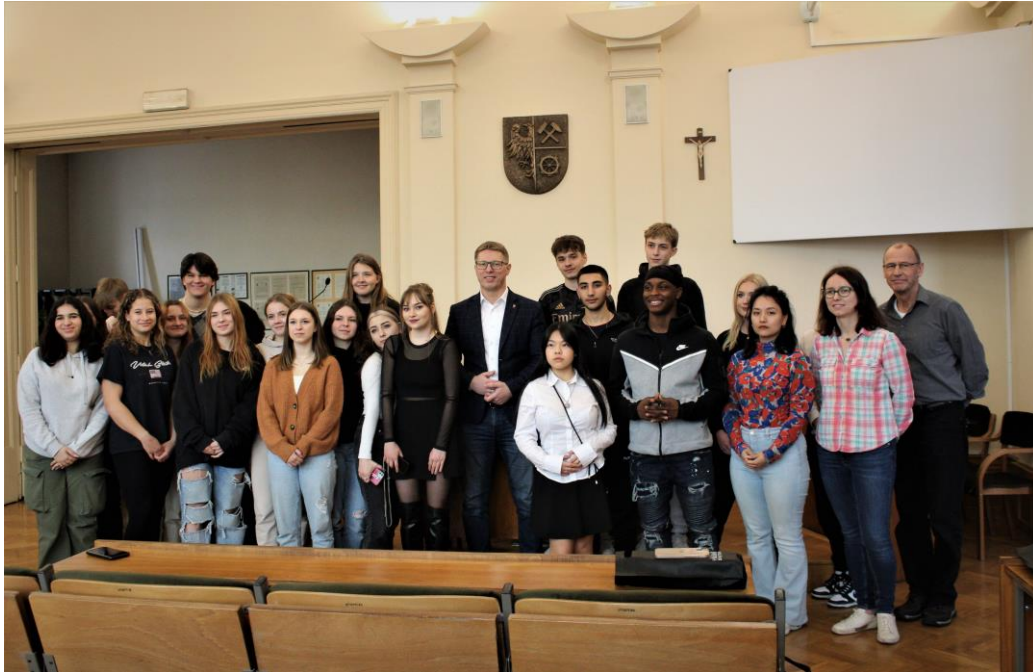
Wizyta Młodzieży z Holandii w ramach wymiany międzynarodowej