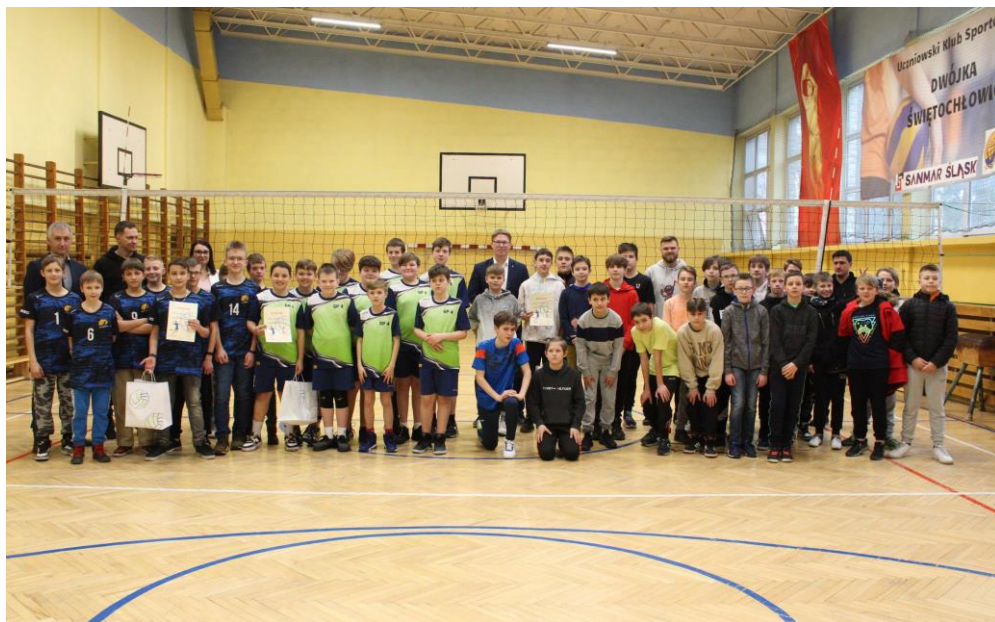
Turnieje w piłce siatkowej