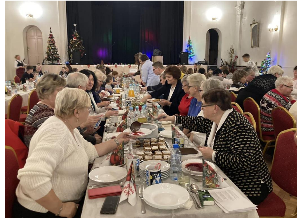
Spotkanie wigilijne podsumowujące projekt „Nowe szanse i możliwości” realizowany przez OPS oraz CIS