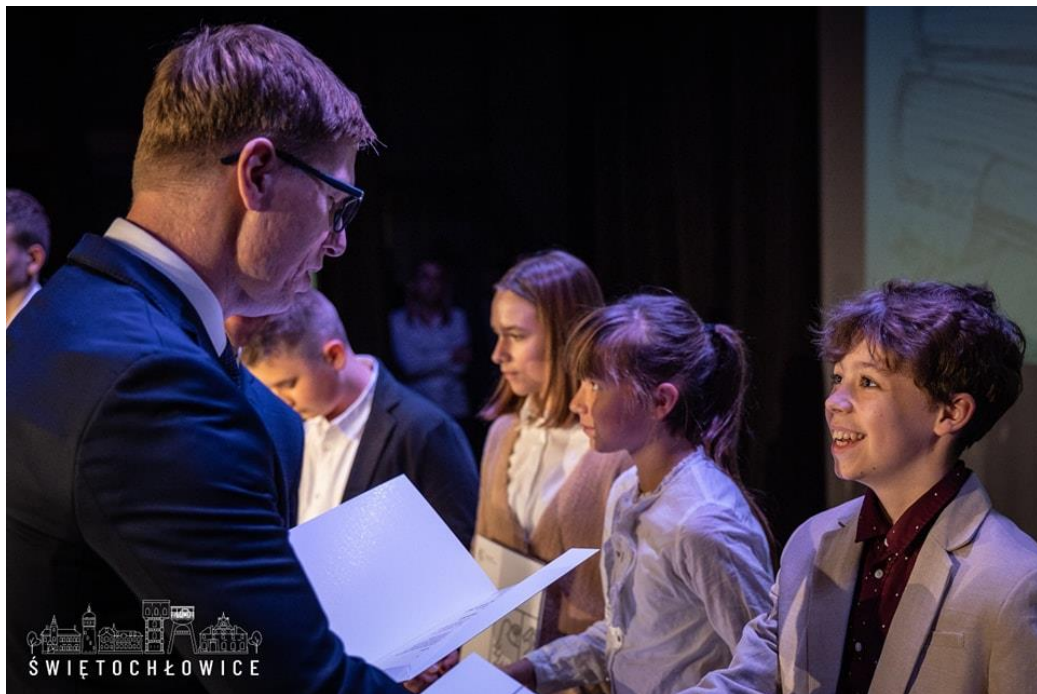
Gala wręczenia stypendiów i nagród Prezydenta Miasta Świętochłowice w Centrum Kultury Śląskiej