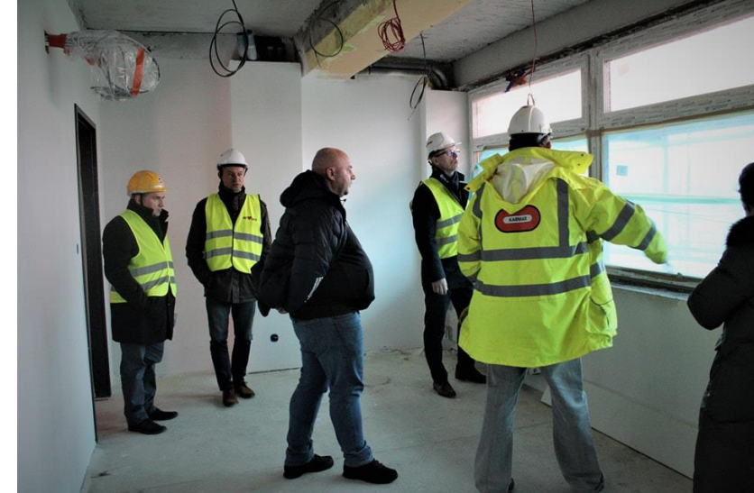
Monitorowanie postępów prac remontowych siedziby OSiR Skałka