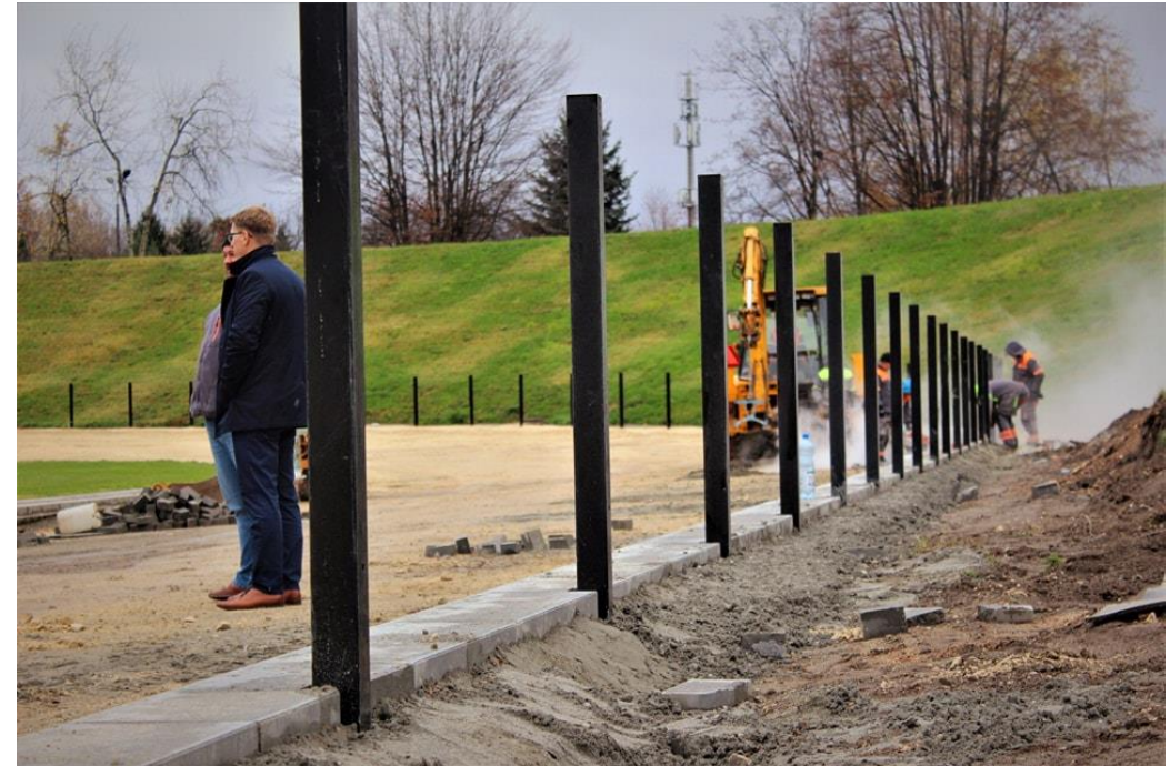
Wizytacja na modernizowanym torze żużlowym na OSIR Skątko