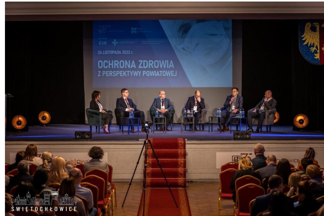
Pierwsza publiczna debata samorządowców i menedżerów służby zdrowia „Ochrona zdrowia z perspektywy powiatowej”. Podpisaniem listu otwartego do Ministra Zdrowia w sprawie ratowania sytuacji szpitali powiatowych