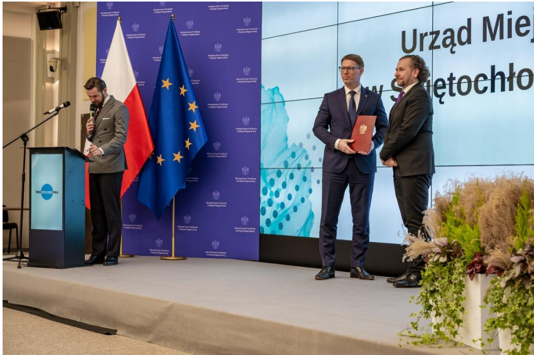
Forum Prostej Mowy w Ministerstwie Funduszy i Polityki Regionalnej