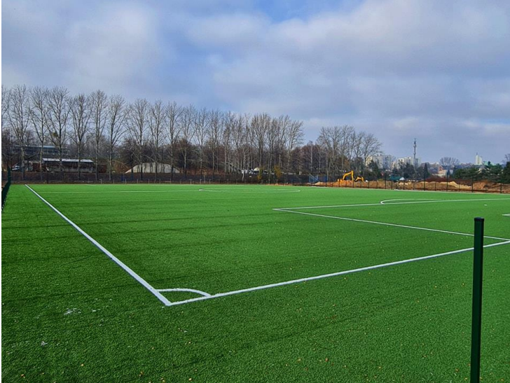
Wizyta na budowie kompleksu boisk na terenie OSiR Skałka