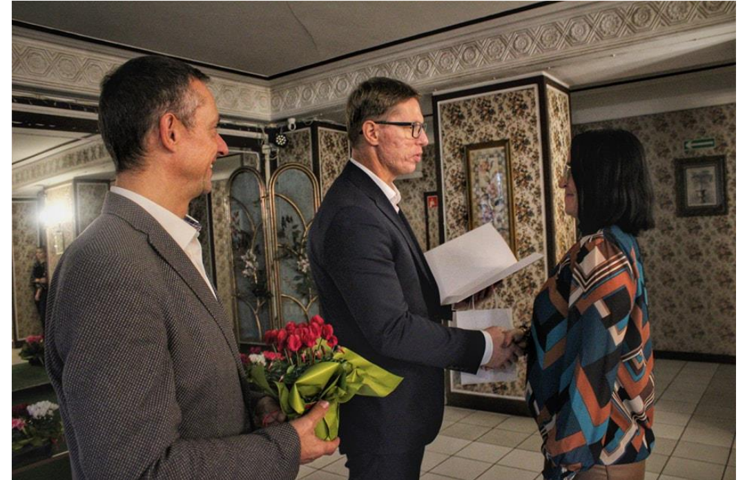
Dzień Pracownika Socjalnego – spotkanie i wręczenie upominków przedstawicielom ośrodków i jednostek zajmujących się pomocą społeczną w mieście