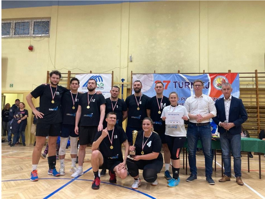
27. Turniej Piłki Siatkowej o Puchar Prezydenta Miasta Świętochłowie organizowany w SP nr 2