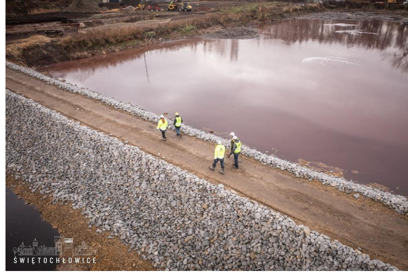
Wizytacja na stawie Kalina