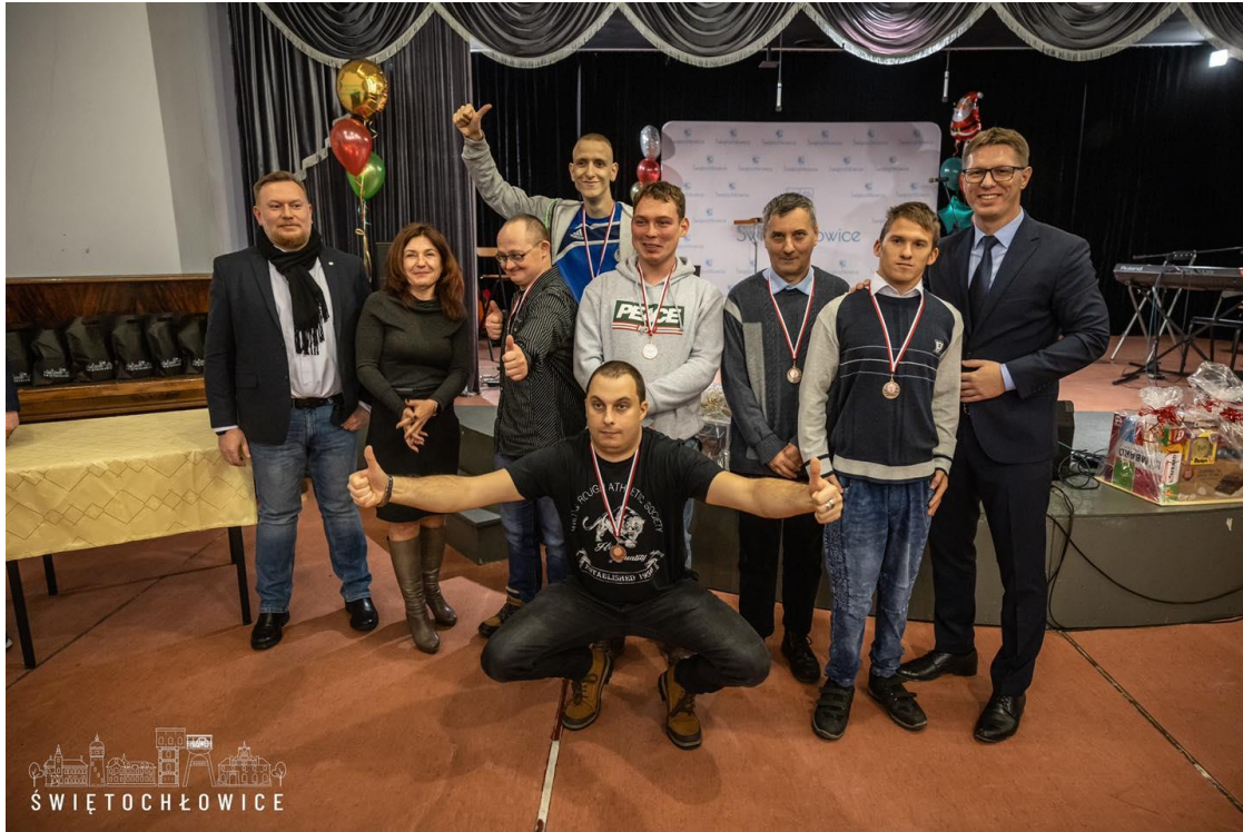
Miejskie obchody Międzynarodowego Dnia Osób z Niepełnosprawnościami