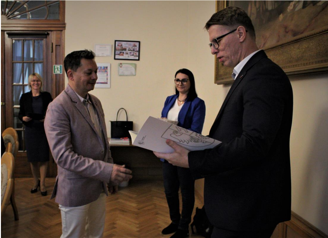
Wręczenie nagród dla „Złotych Rączek” – pracowników obsługi świętochłowskich szkół i przedszkoli