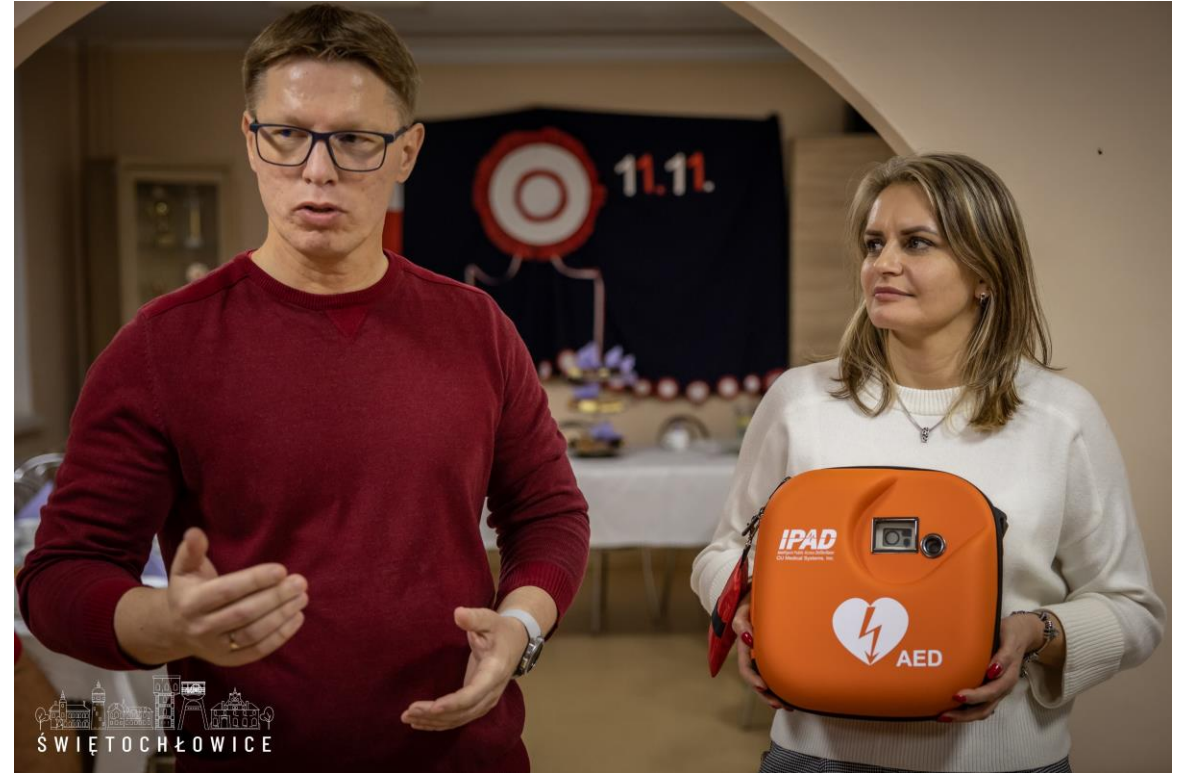
Przekazanie Miejskiemu Domowi Pomocy Społecznej „Złota Jesień” w Świętochłowicach defibrylatora i sprzętu medycznego zakupionego w ramach budżetu obywatelskiego