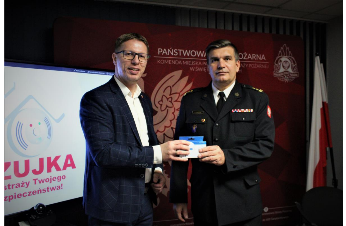
Akcja „Czujka na straży Twojego bezpieczeństwa”