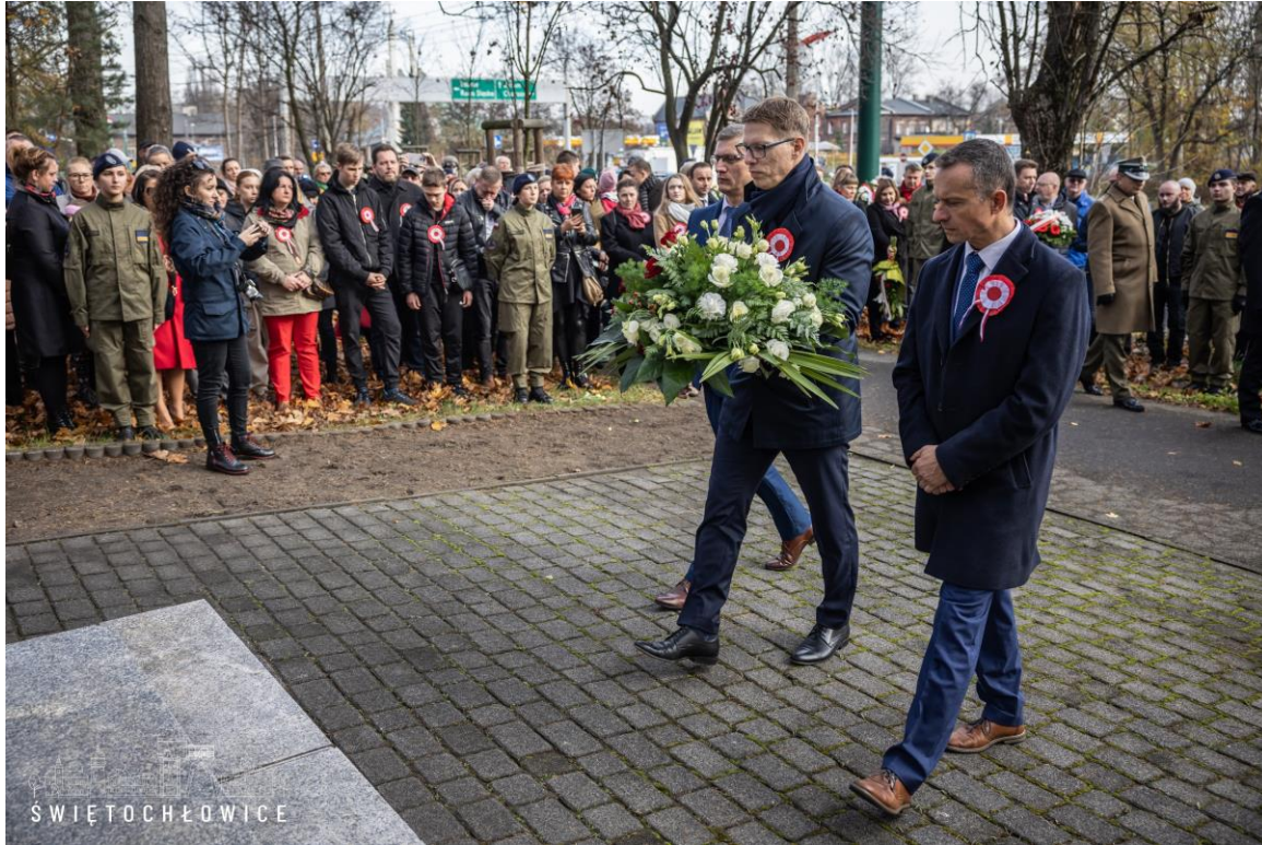
Udział w uroczystych obchodach Narodowego Dnia Niepodległości