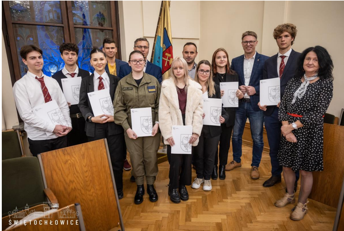
Powołanie na II kadencję radnych Młodzieżowej Rady Miejskiej