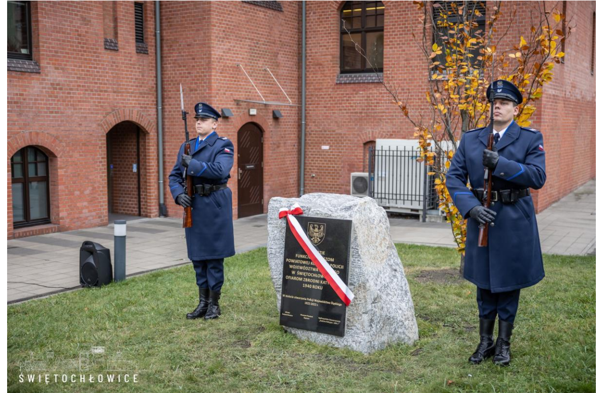
Odświeżenie tablicy upamiętniającej policjantów powiatu świętochłowskiego zamordowanych w 1940 r.