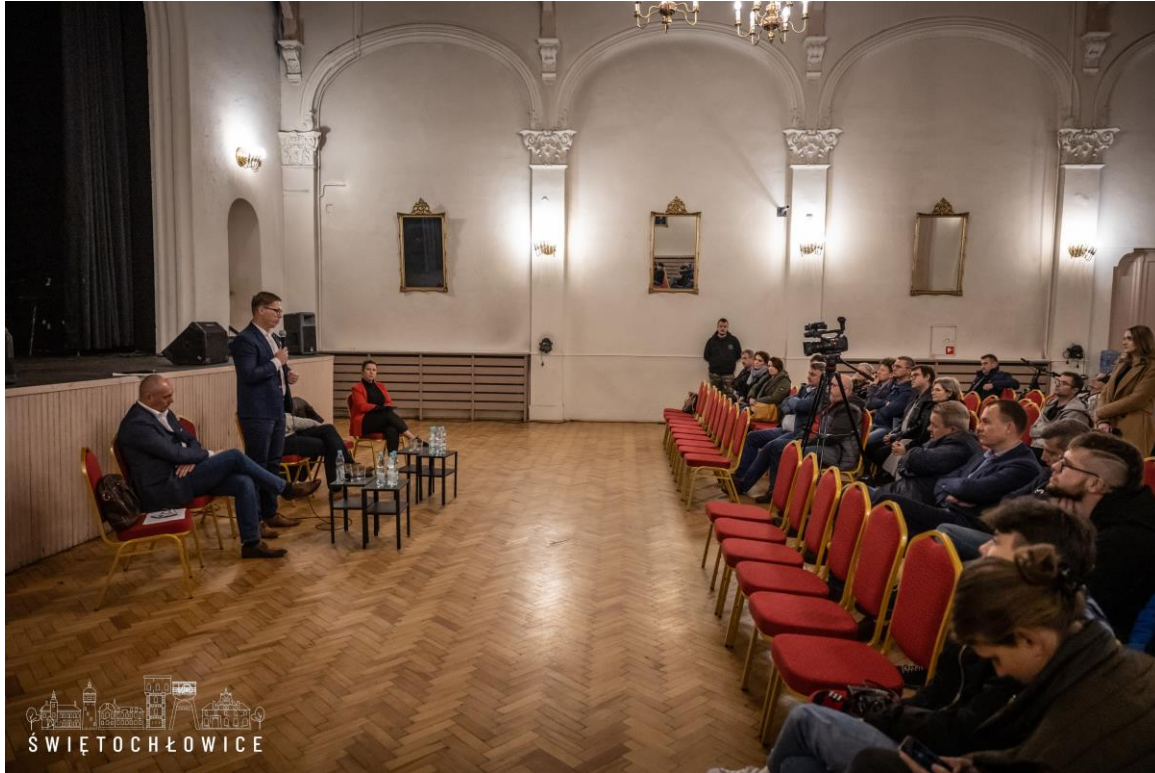
Konsultacje społeczne w sprawie przyszłości tzw. „domków fińskich”