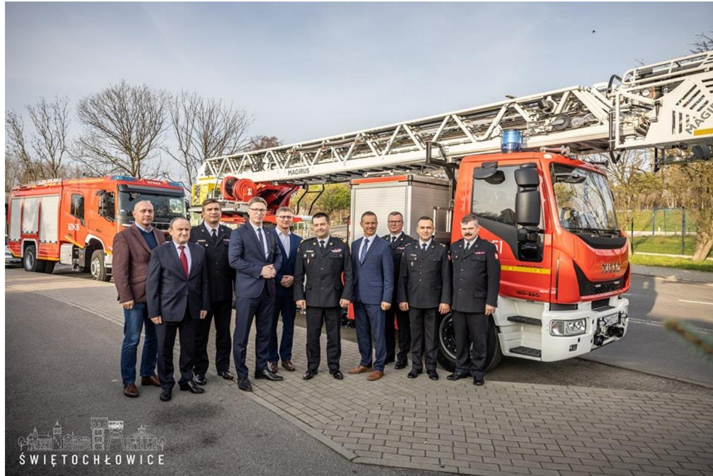
Przekazanie dwóch wozów strażackich Komendzie Miejskiej Państwowej Straży Pożarnej w Świętochłowicach