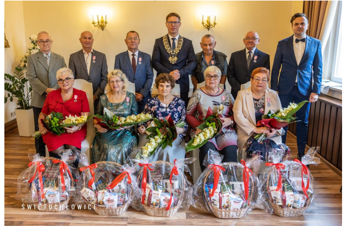
Spotkania z jubilatami złotych, diamentowych i żelaznych godów