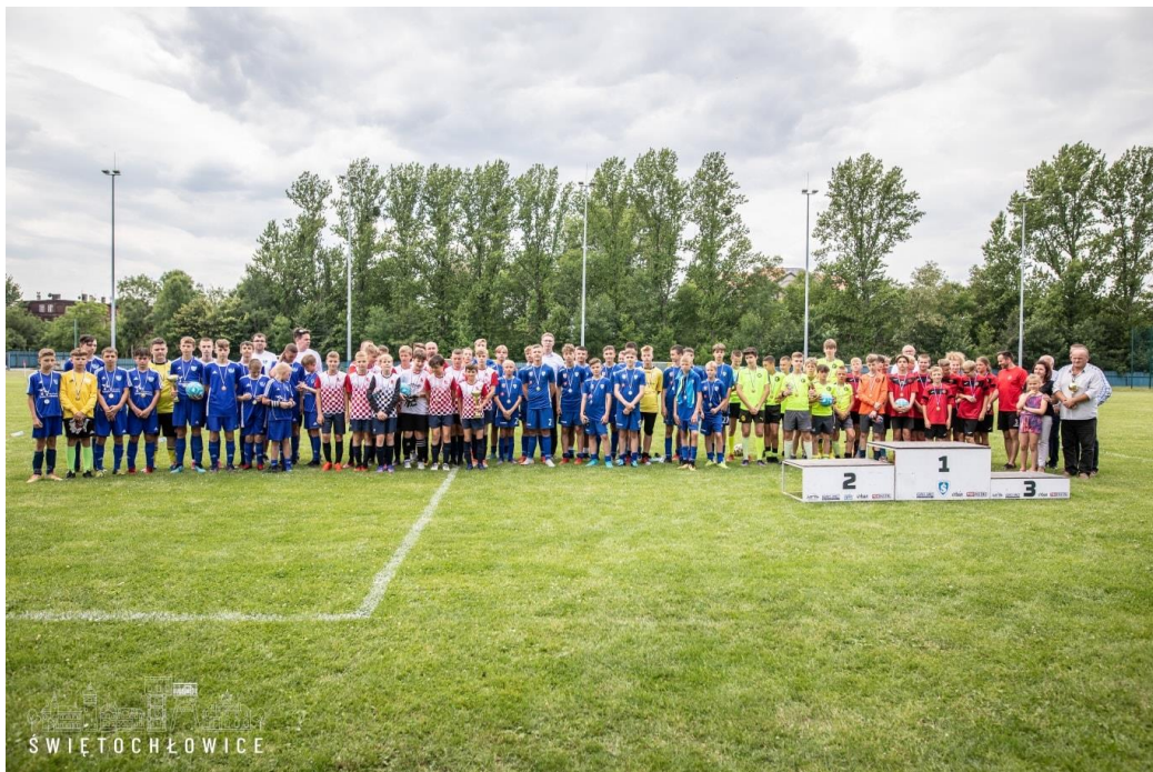
II Memoriał im. Reinharda Piontka