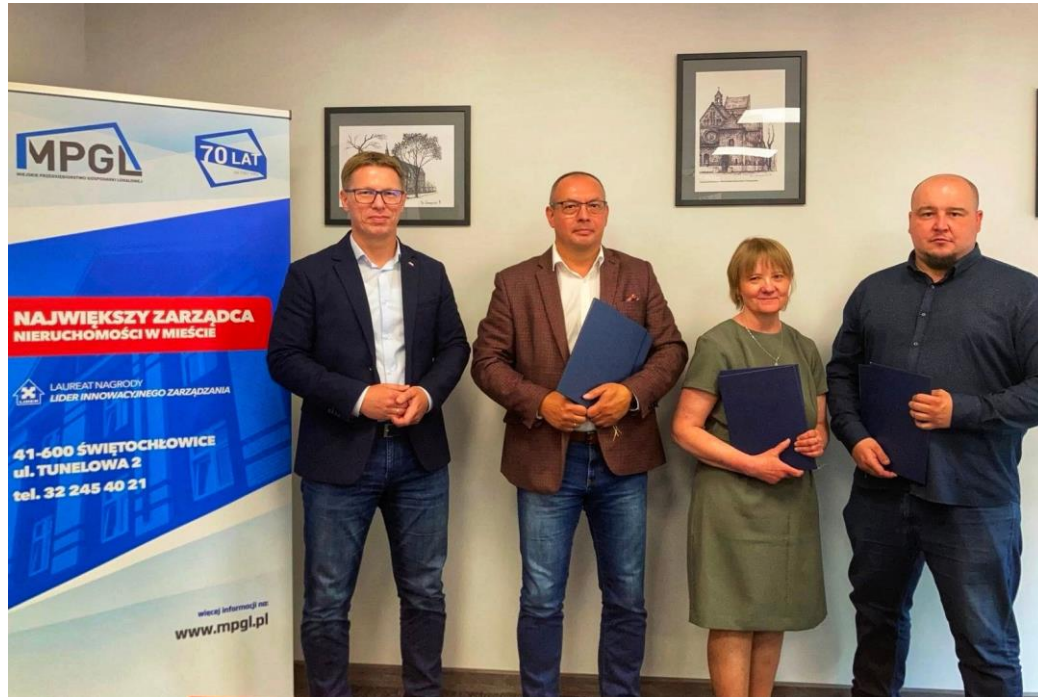
Podpisanie umowy na remont 36 mieszkań w Dzielnicy Lipiny