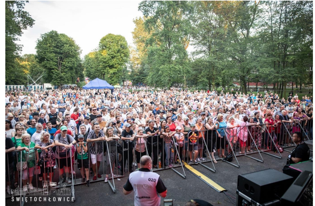
Dni Miasta 2022