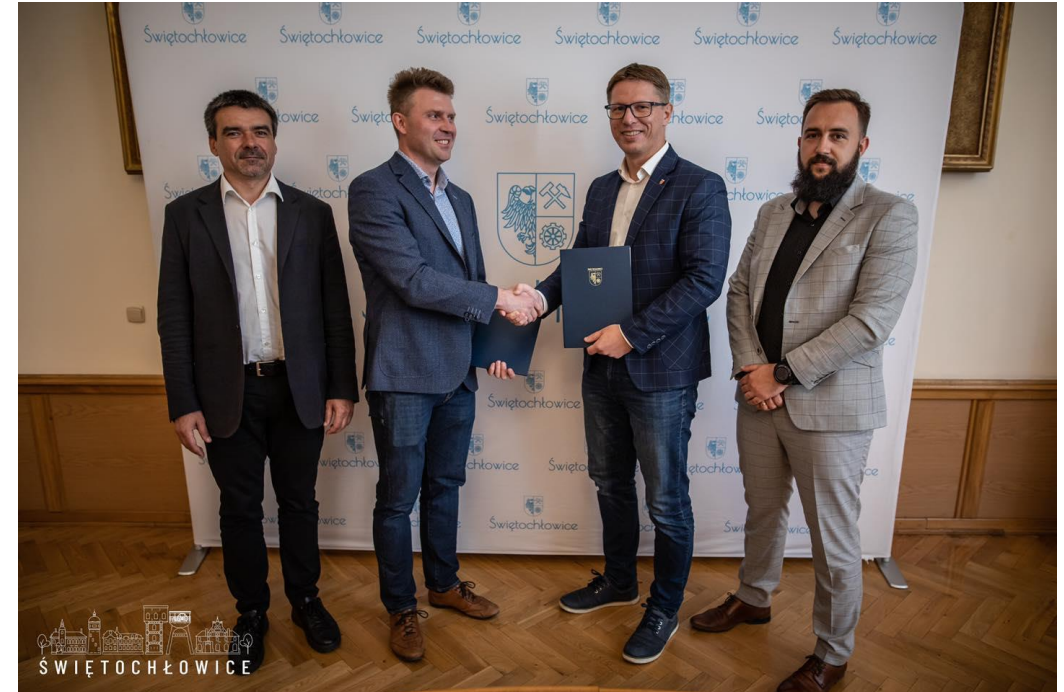
Podpisanie umowy na przebudowę DTŚ wraz z węzłem komunikacyjnym z ul. Bytomską