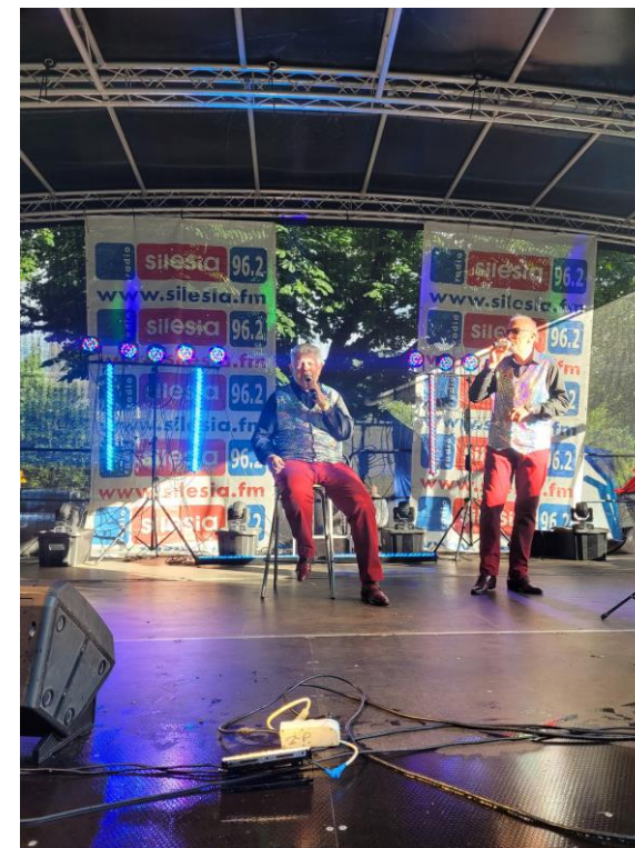
Muzyczne Spotkania Sąsiadów z Radiem Silesia