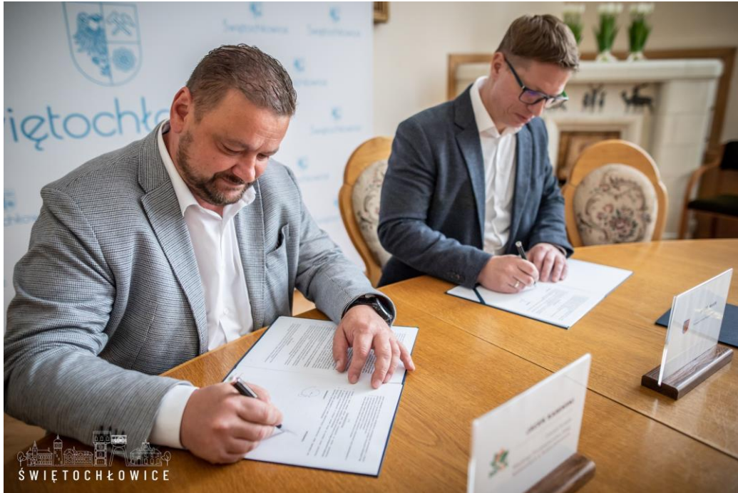
Podpisanie umowy na modernizację układu drogowego ul. Szczytowa i Sportowa