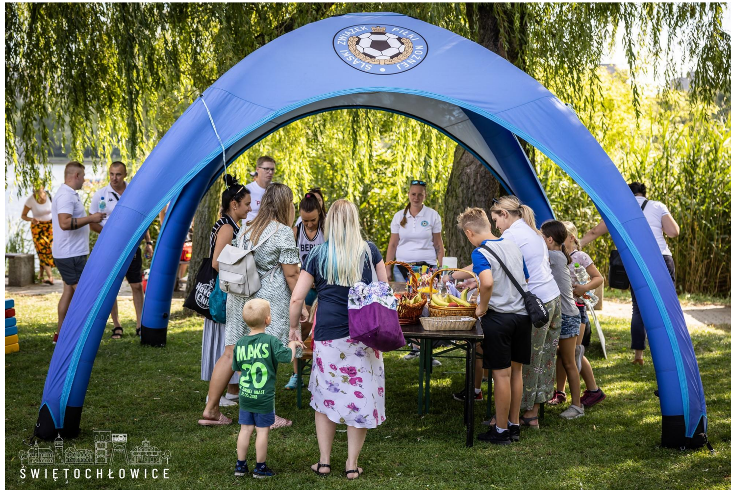
„Akcja Lato” organizowana przez Śląski Związek Piłki Nożnej