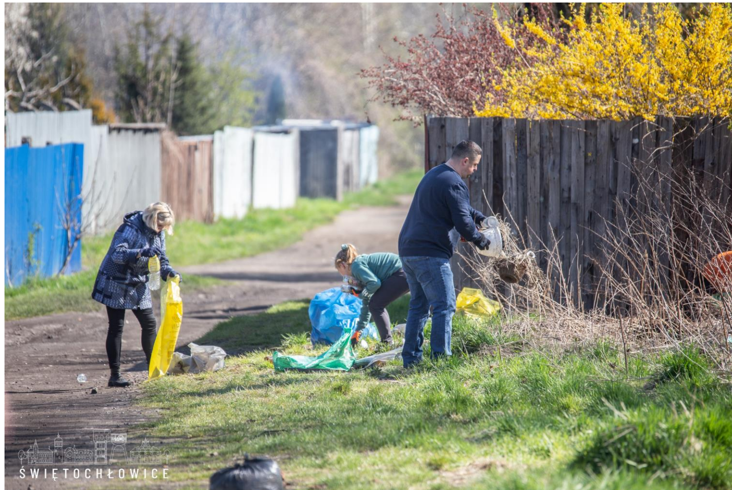
Udział w akcji sprzątania terenu „na Banie”