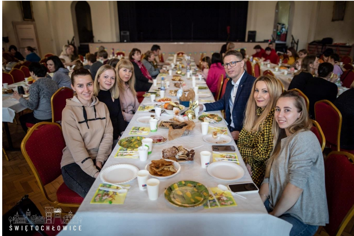
Wspólne świętowanie Wielkanocy z uchodźcami z Ukrainy w CKŚ Grota