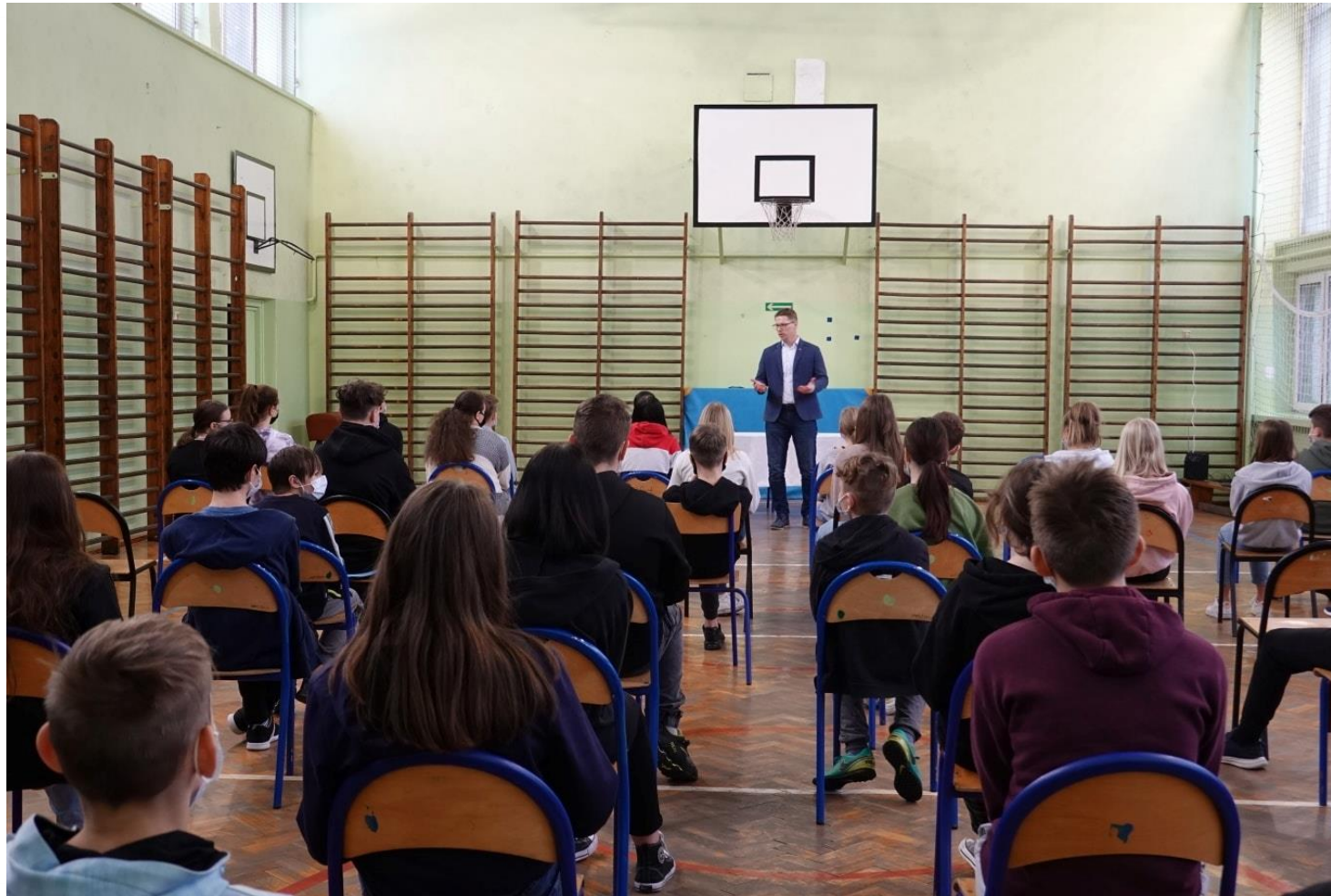
Spotkania z ósmoklasistami