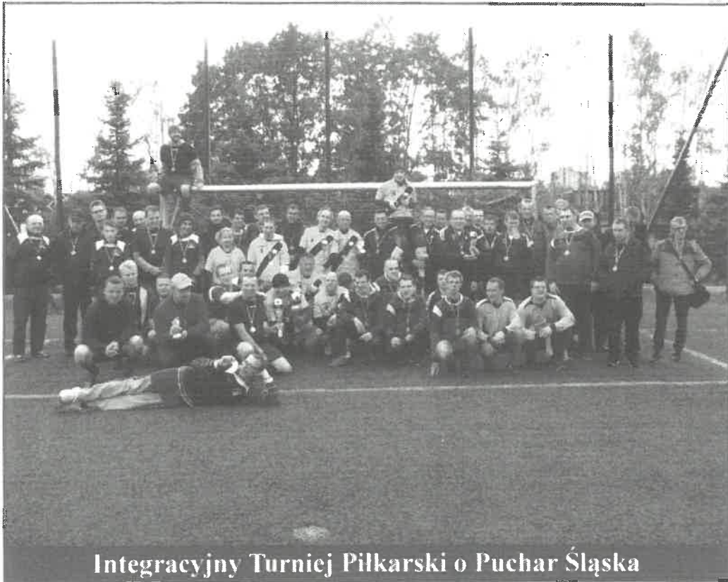
Integracyjny Turniej Piłkarski o Puchar Śląska