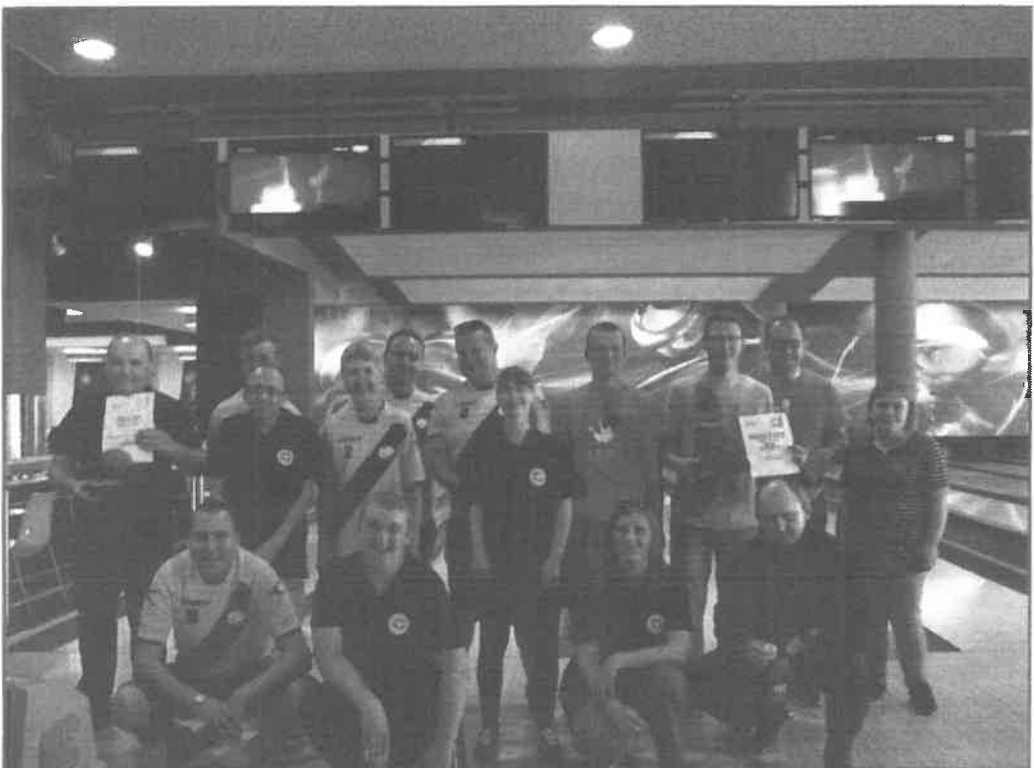
II MIĘDZYWARSZTATOWY BOWLING CUP