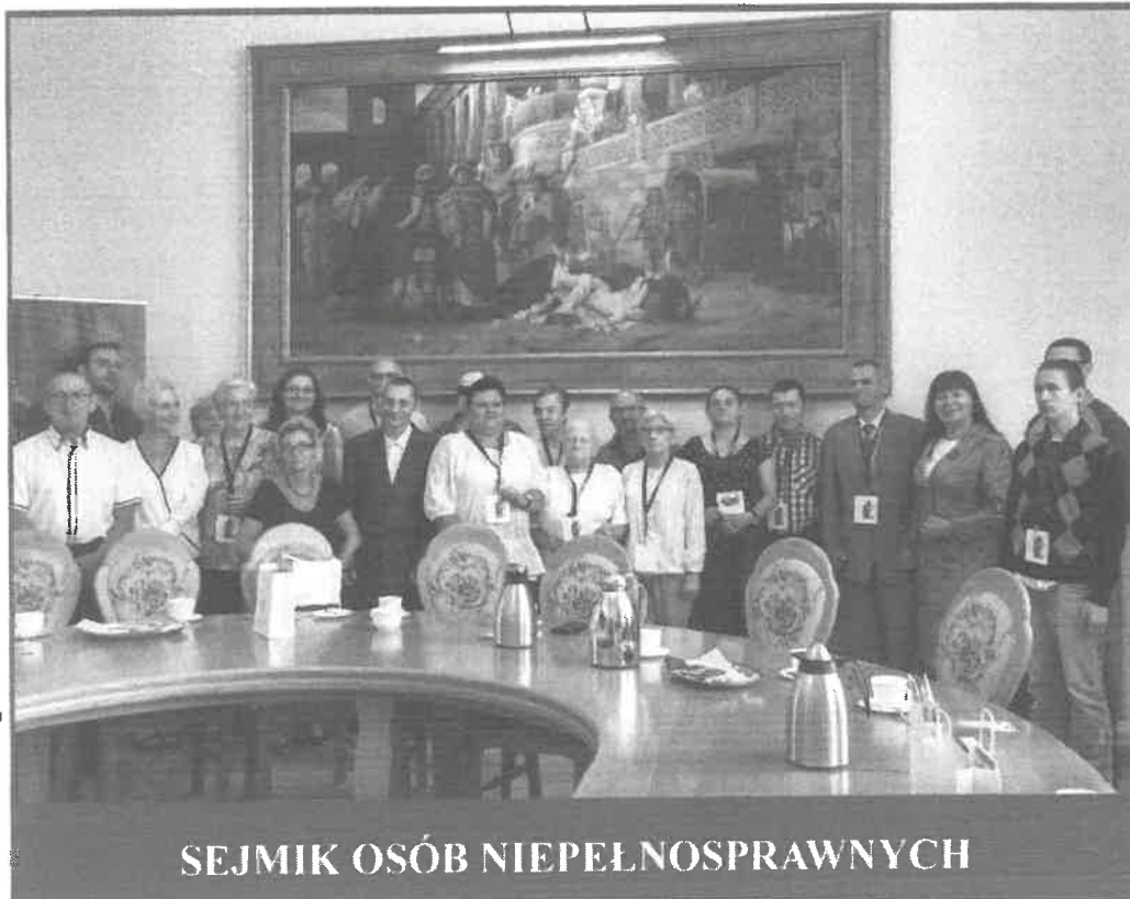
SEJMIK OSÓB NIEPEŁNOSPRAWNYCH