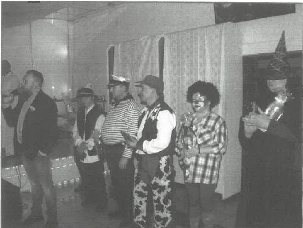
X BAL KARNAWAŁOWY