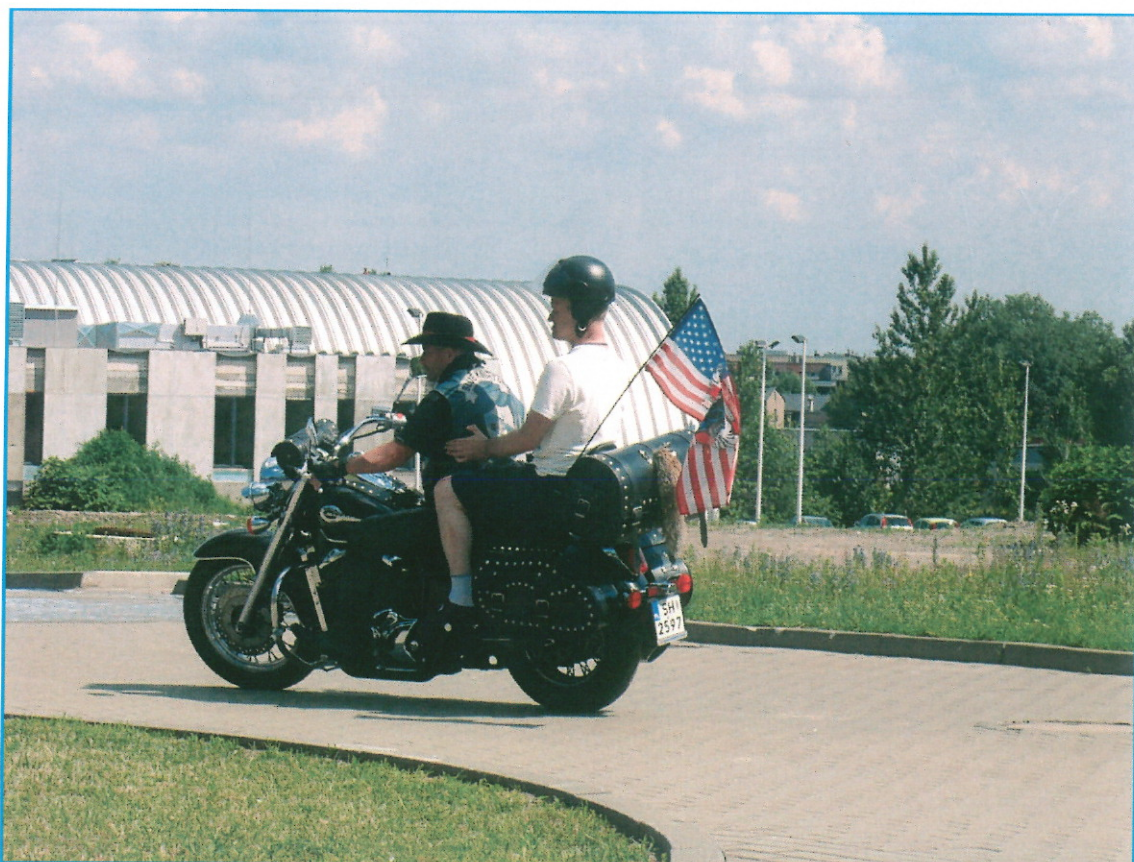
Akcja "BEZPIECZNE WAKACJE"