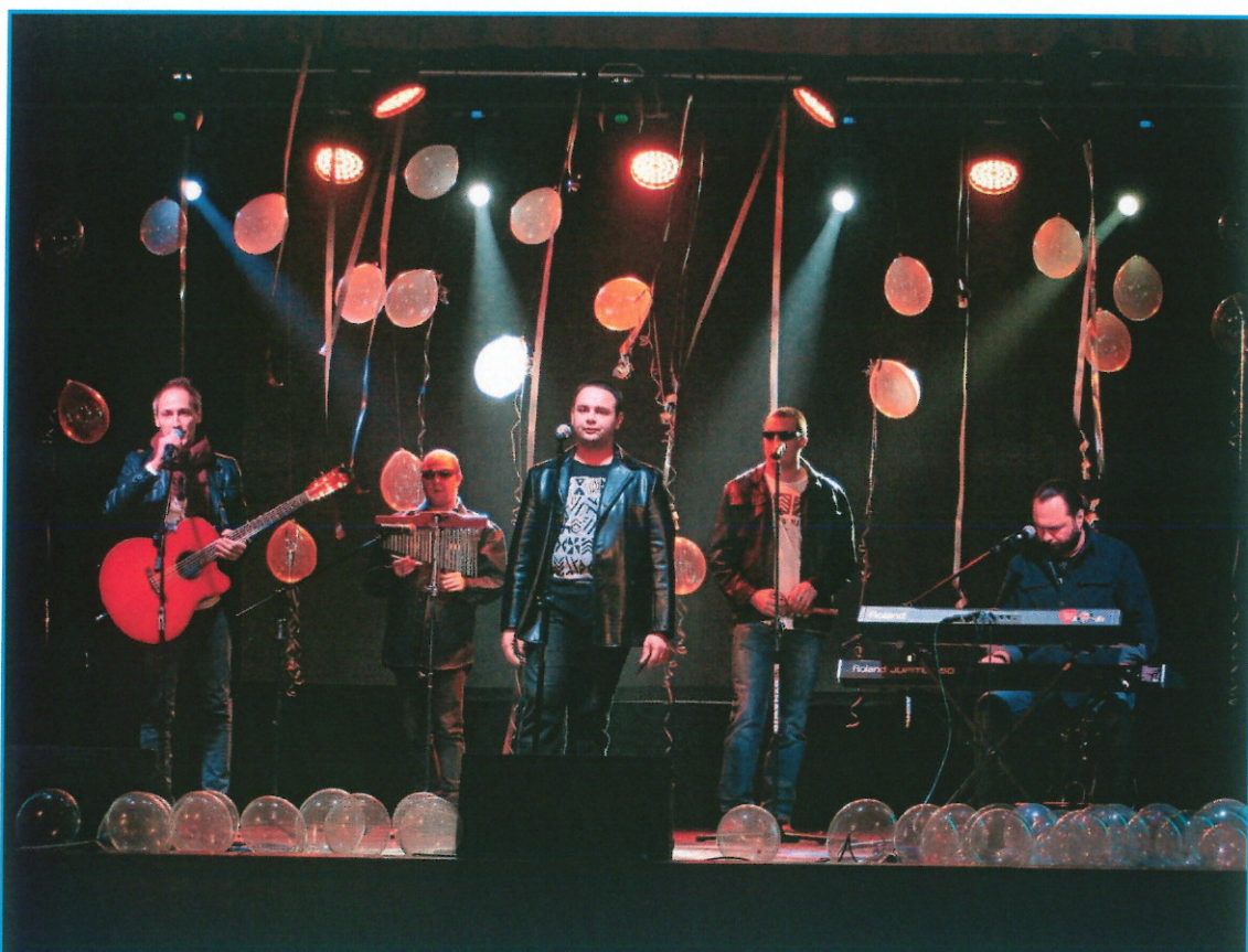
Zespół Integacyjny TOLERANCJA