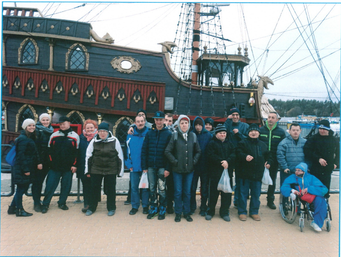
Wyjazd rehabilitacyjny do Poddąbia