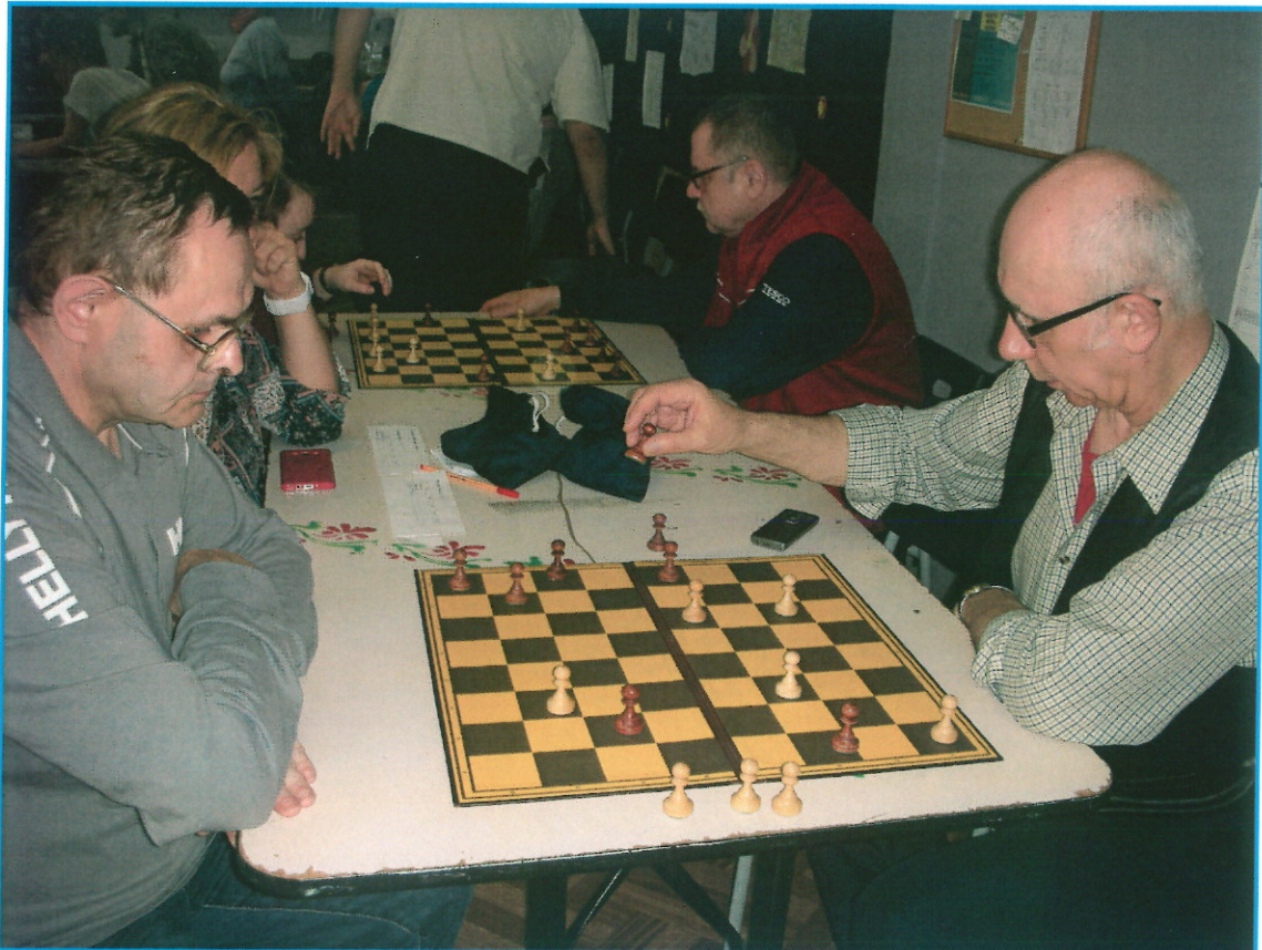
Turniej "GRAMY RAZEM"