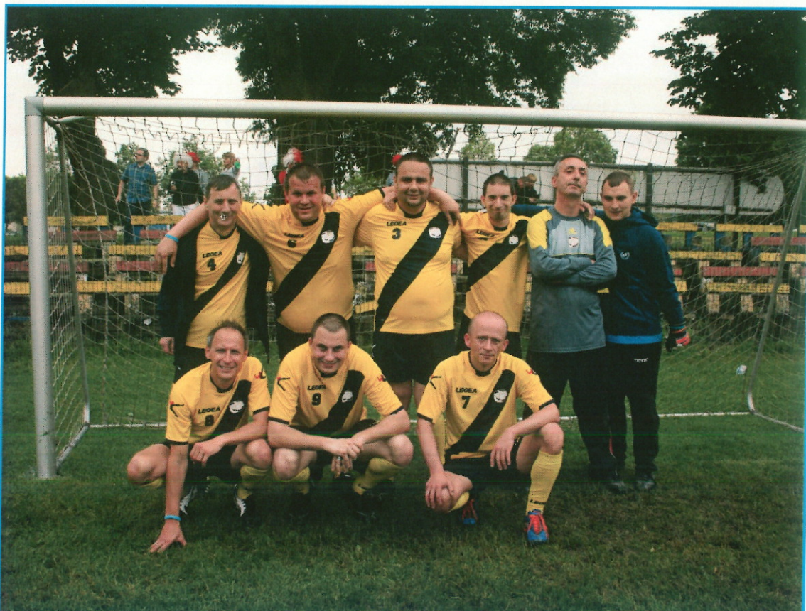
“NA ZIELONEJ MURAWIE”