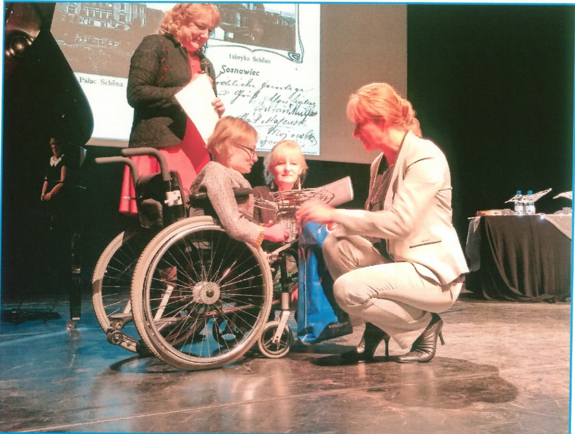
Przeгляд "IDY LISTOPADOWE"