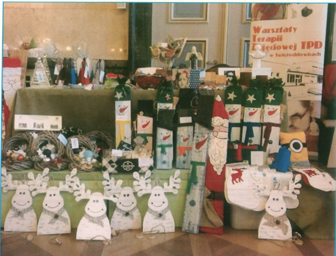
Kiermasz w Urzędzie Wojewódzkim