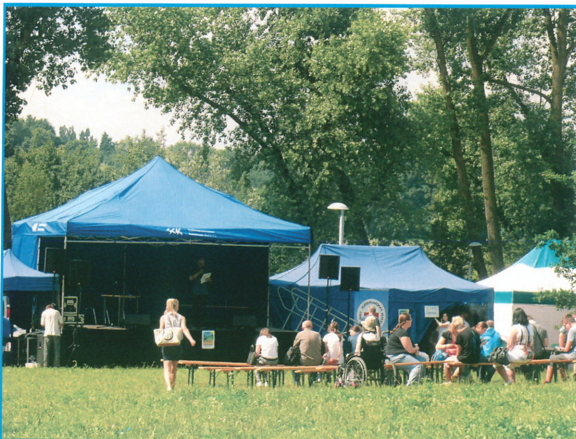
VI Piknik Integrycyjny Osób Niepełnosprawnych