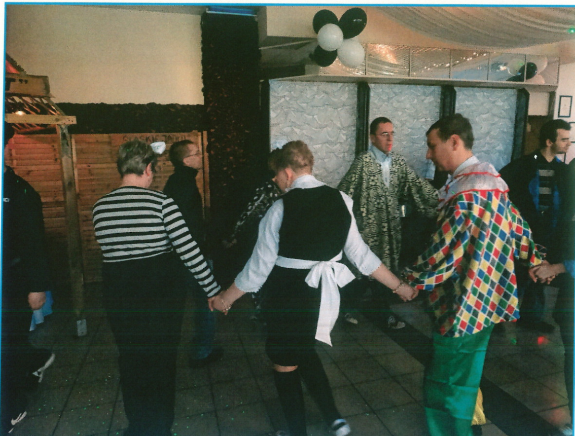
VIII BAL KARNAWAŁOWY